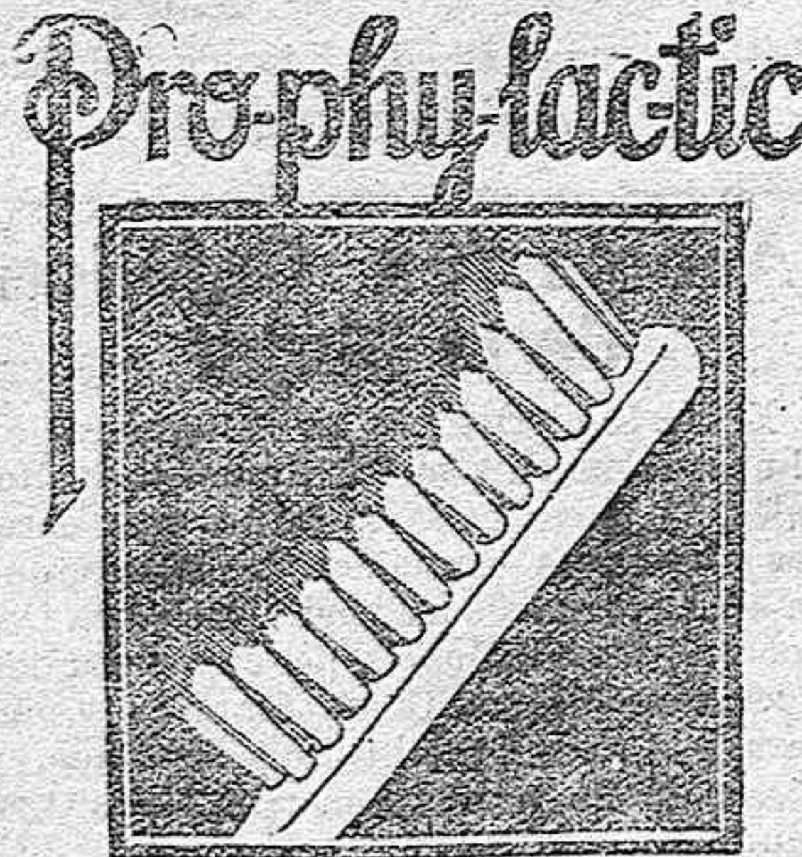
EL CEPILLO DE DIENTES en su estuche amarillo

Los tejidos y confecciones de EL METRO son tan acreditados como la leche y la manteca de la «Granja Eulalia».