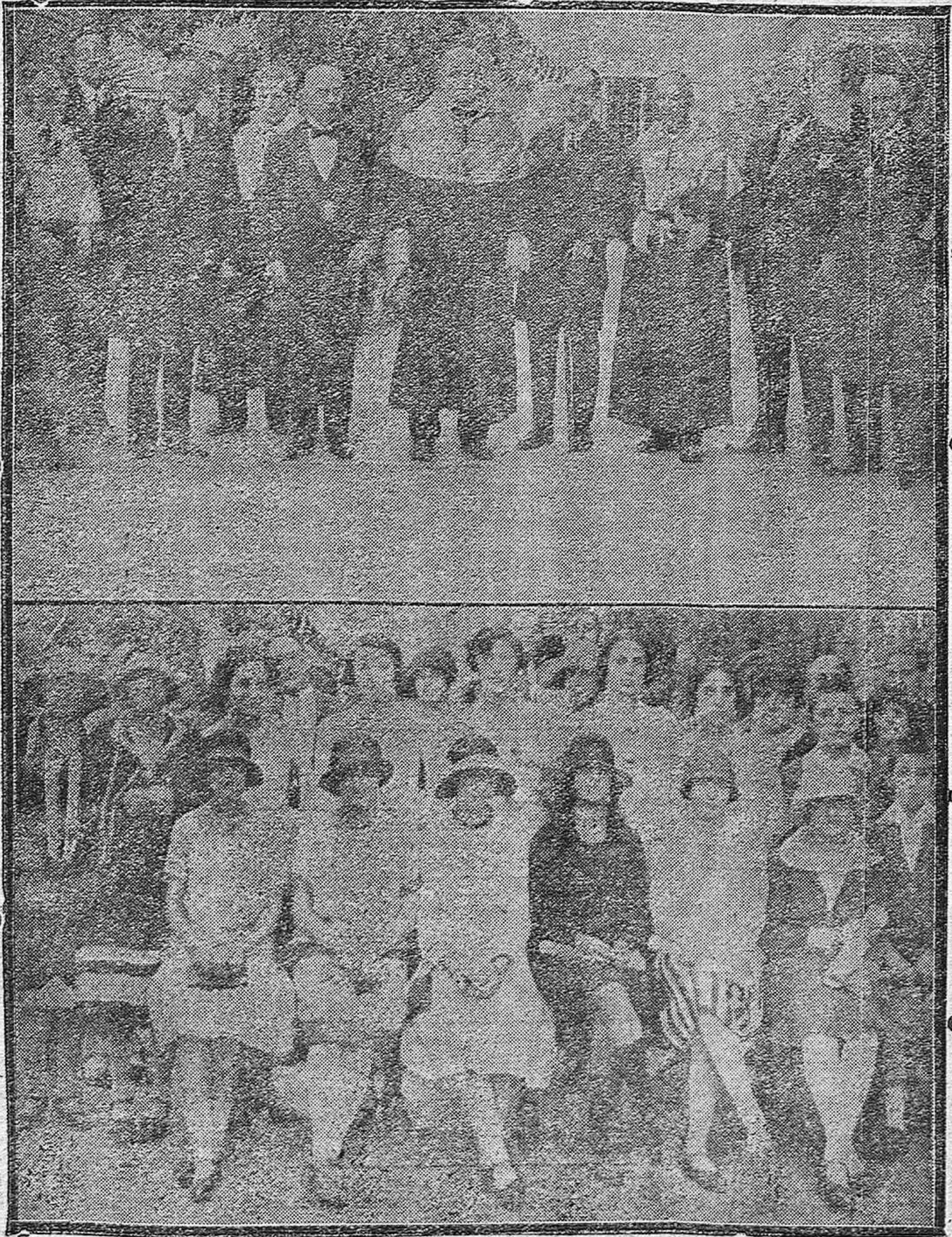
1.º Apertura del Curso escolar. El Director del Instituto de 2.ª Enseñanza con las autoridades y Directores de Centros docentes oficiales al terminar el acto.—2.º Distinguidas y bellas señoritas que fueron premiadas en tan solemne acto.