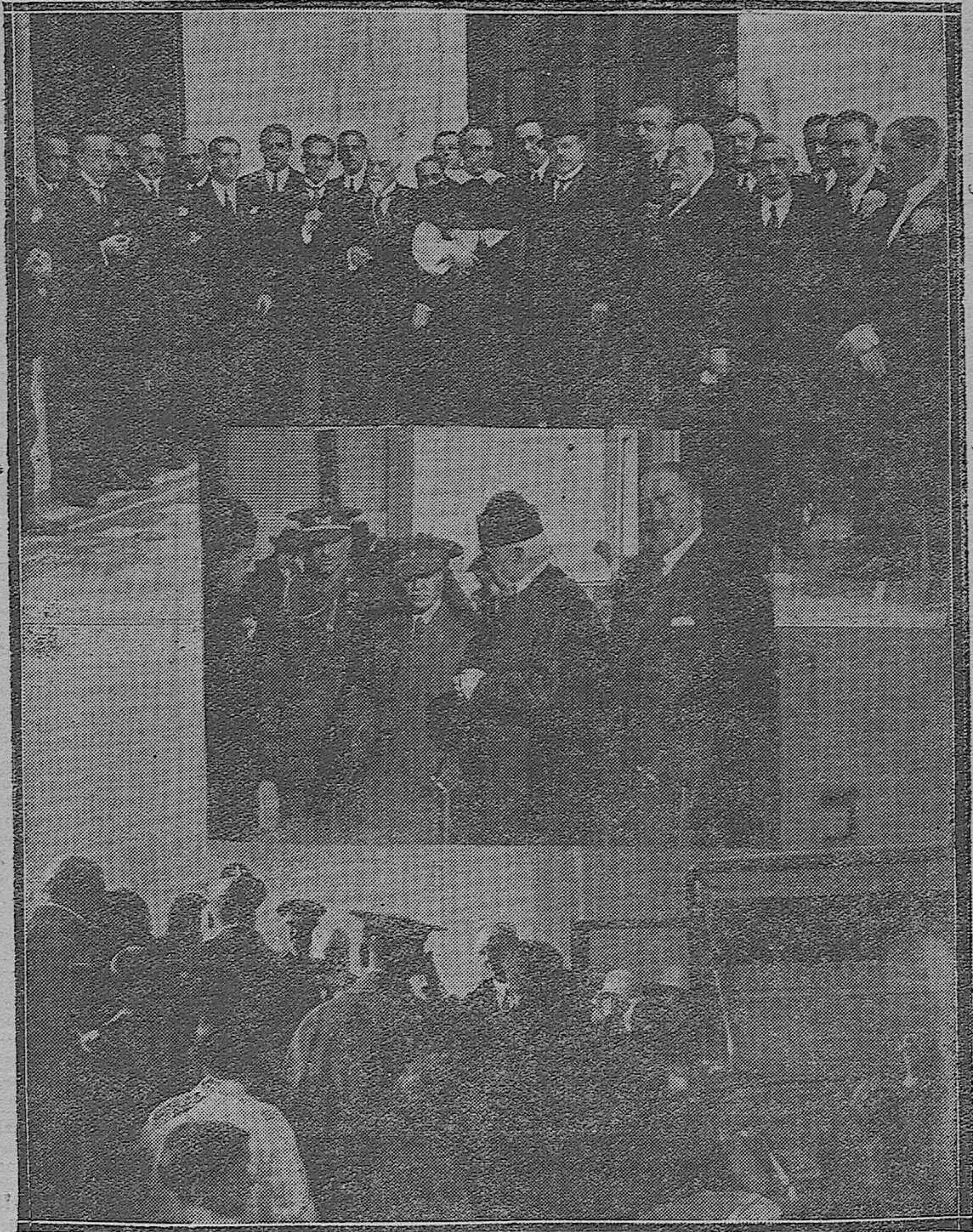
Varios momentos de los actos celebrados por los abogados cordobeses en honor de sus Santos Patronos.