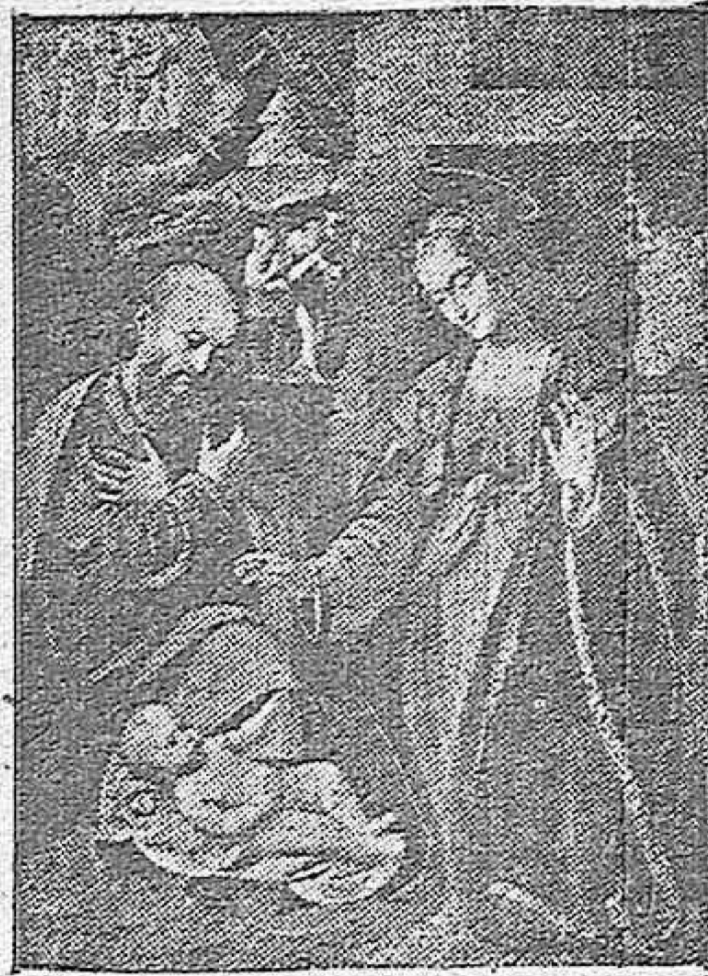
La Sagrada Familia (Escuela de Leonardo de Vinci)