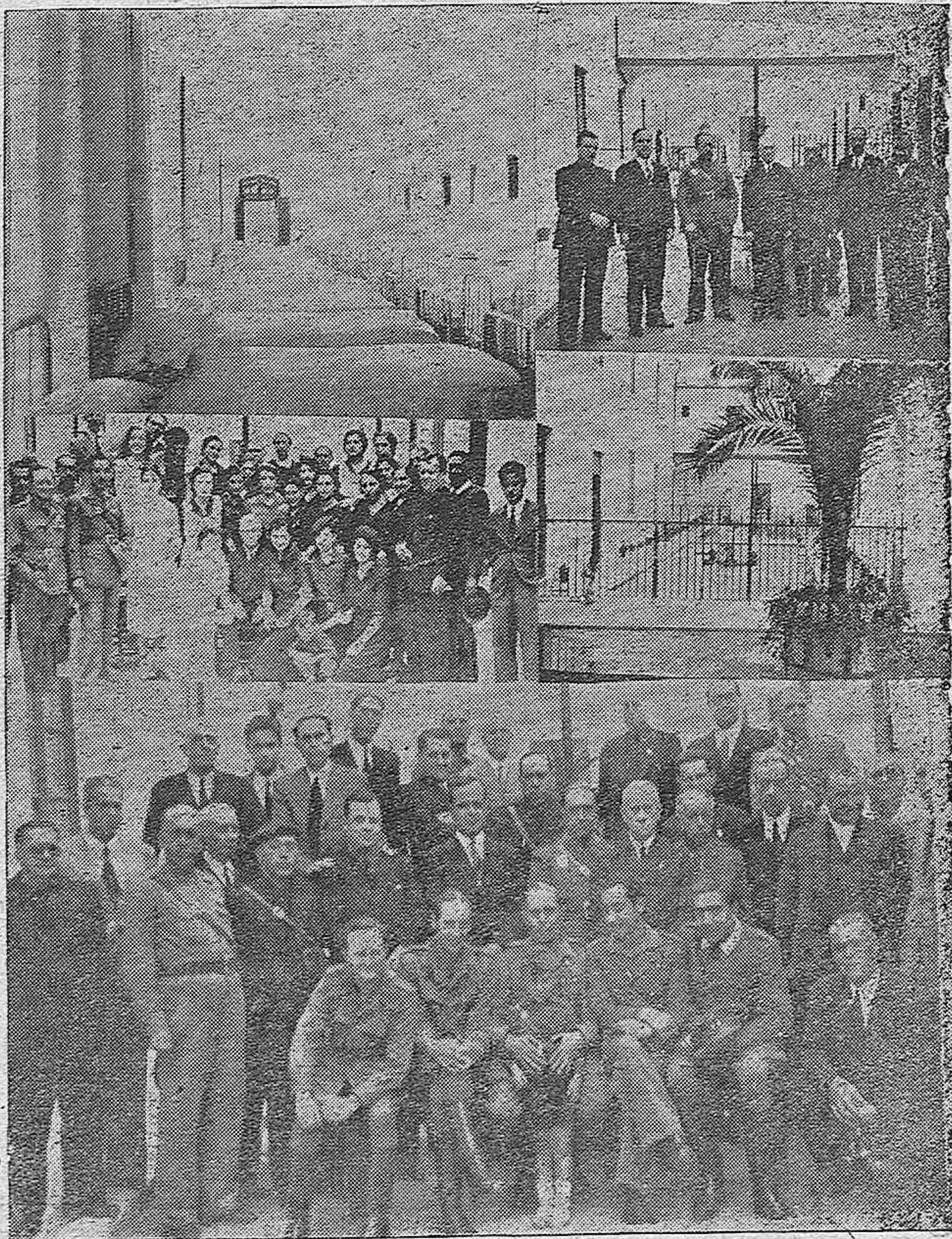
INAUGURACION DEL ASILO PARA ANCIANOS, DE NUESTRA SEÑORA DE LOS DOLORES EN MONTILLA.—Diversos aspectos del edificio, instalación, y concurrentes al acto.