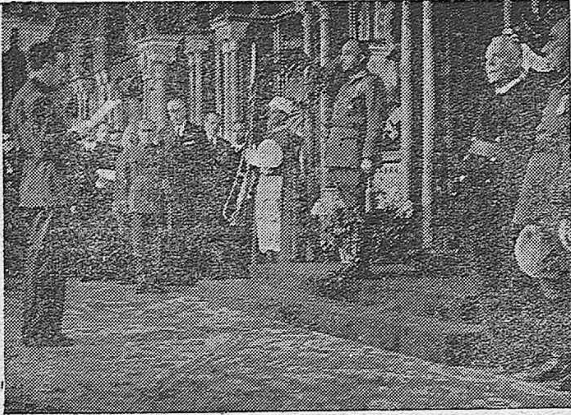
El jefe del Movimiento en Vizcaya y Alcalde de Bilbao, camarada Oriol, leyendo en presencia del Caudillo y del Gobierno, el Mensaje de la ciudad durante la recepción celebrada en el Ayuntamiento.