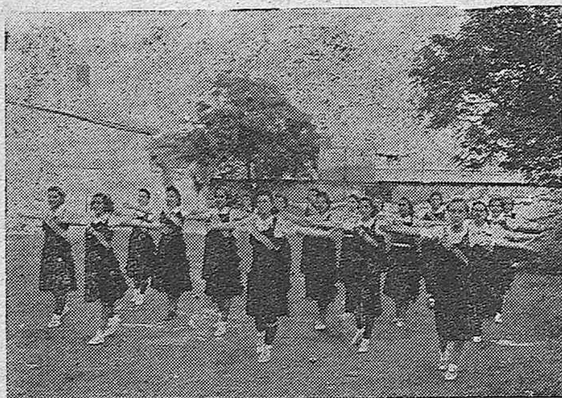
Camaradas de la Sección Femenina (S.E. U.) que forman parte del equipo cordobés que concurrirá a la semana deportiva de Sevilla.