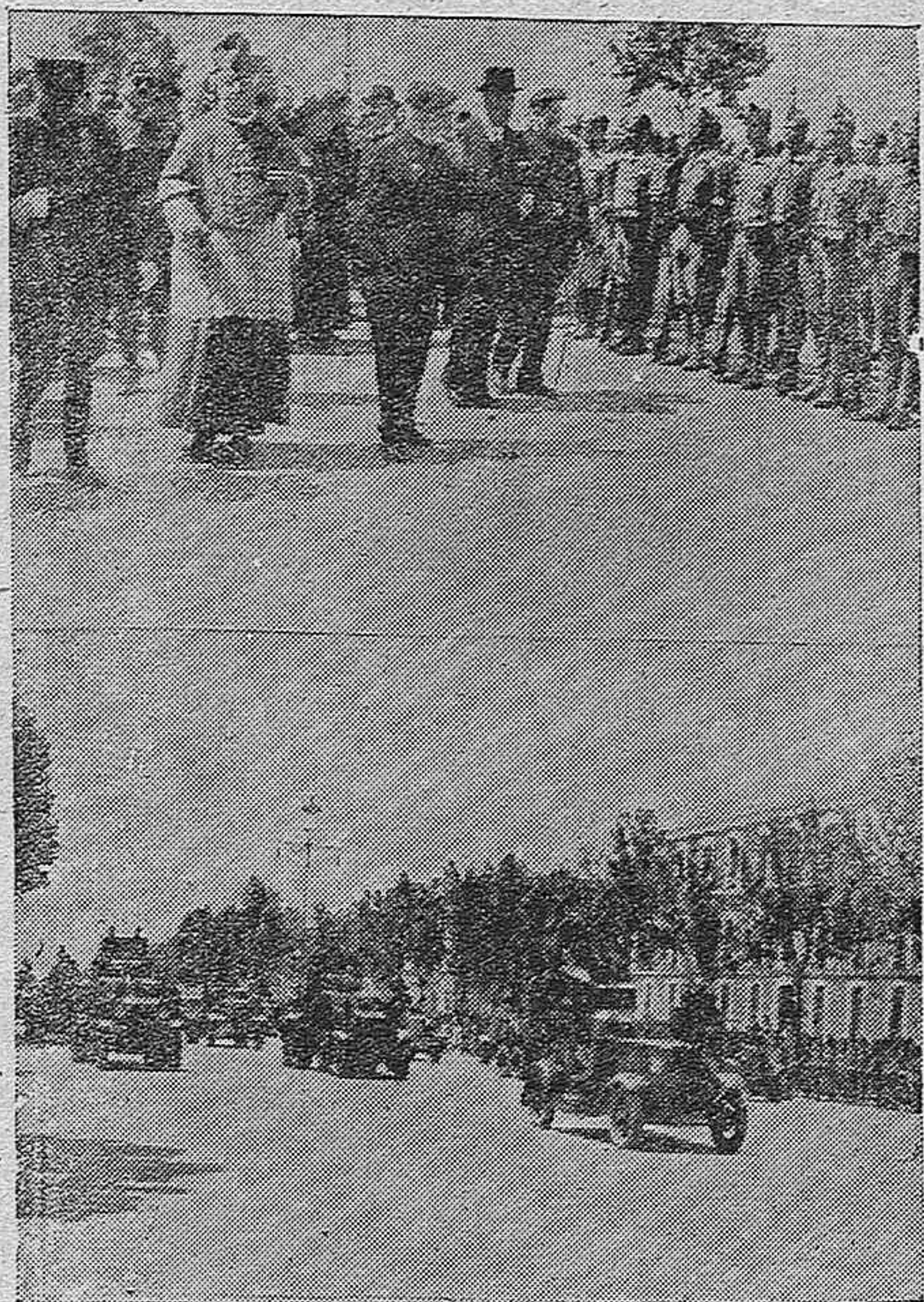
LA FIESTA DE LA VICTORIA EN CORDOBA.—Las autoridades pasan ante las fuerzas formadas en el desfile.—Los tanques desfilando ante los Pabellones del Paseo de la Victoria.