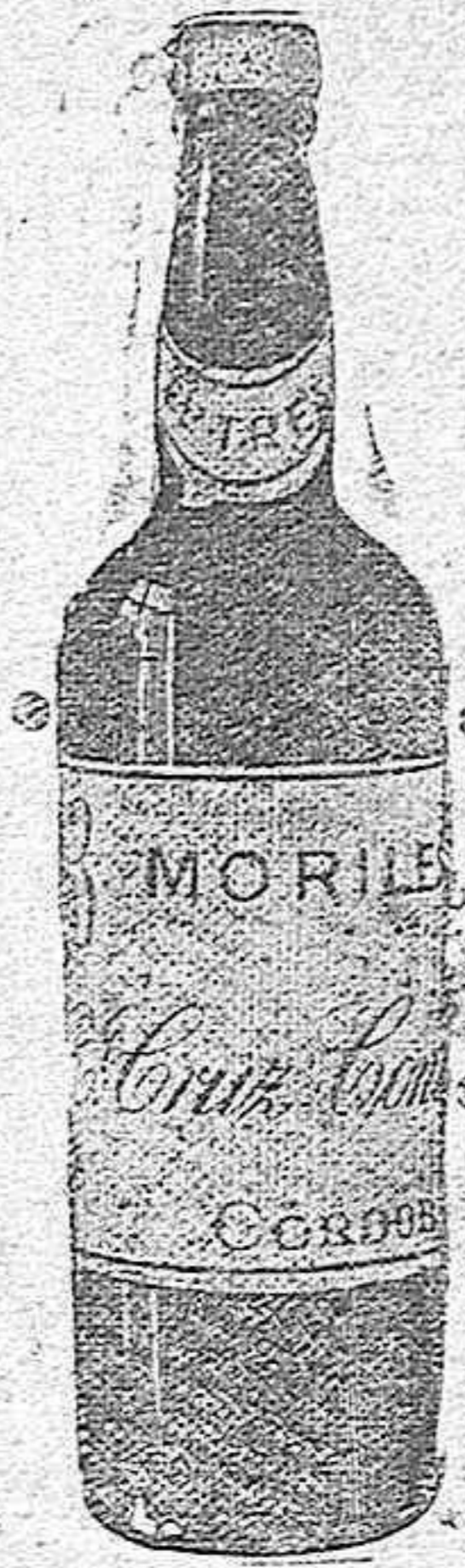
Moriles "El Tres"

Ocasión; Mantas de fleco desde 3 pesetas; mantas finas de viaje desde 5'50 y mantas lana para cama desde 7'50 en El Metro y sus Sucursales.