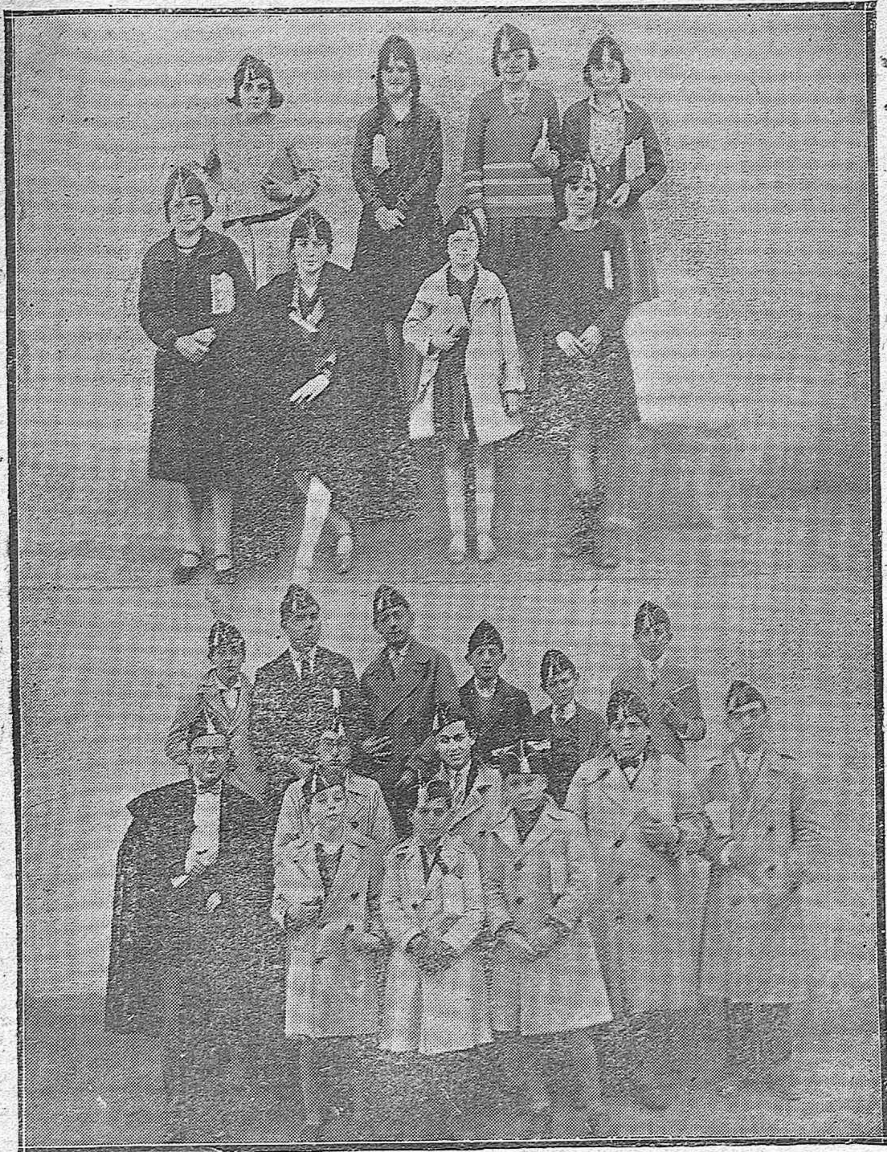
HE AQUÍ DOS FOTOS INTERESANTES.—Arriba: Un grupo de bellísimas estudiantes, llevando airoosamente el gorro estudiantil, que les da cierto aire bizarro de heroínas del Tercio.—Abajo: Unos cuantos estudiantes tocados de la simbólica prenda.