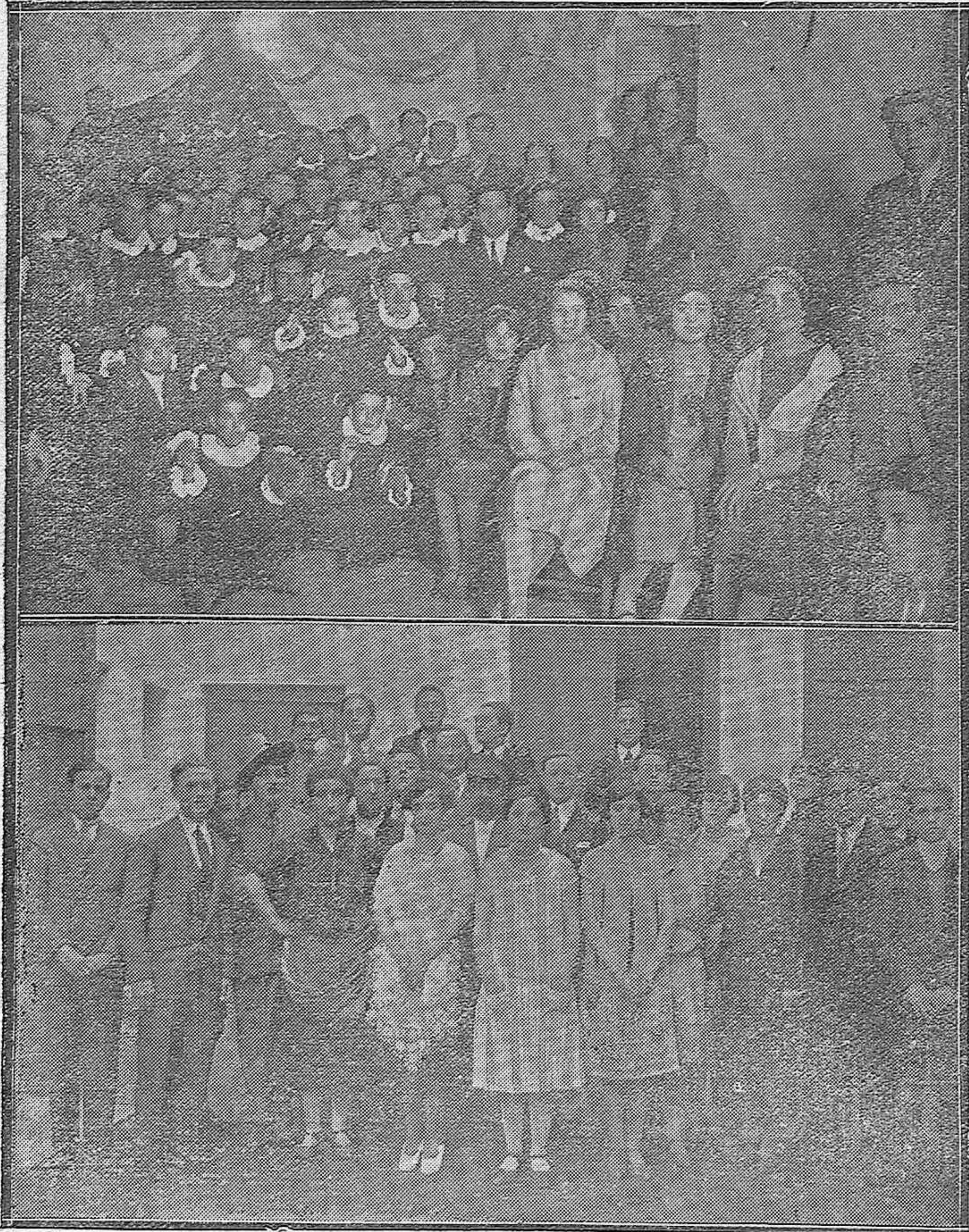
DEL PASADO CARNAVAL. —En la Filarmónica Bubio: La agrupación artística de dicha entidad musical durante el concierto dado en su domicilio social con motivo de las pasadas fiestas.— EL PATRON DE LOS ESTUDIANTES: Los alumnos que tomaron parte en la velada teatral celebrada en el Duque para solemnizar la festividad de Santo Tomás de Aquino.