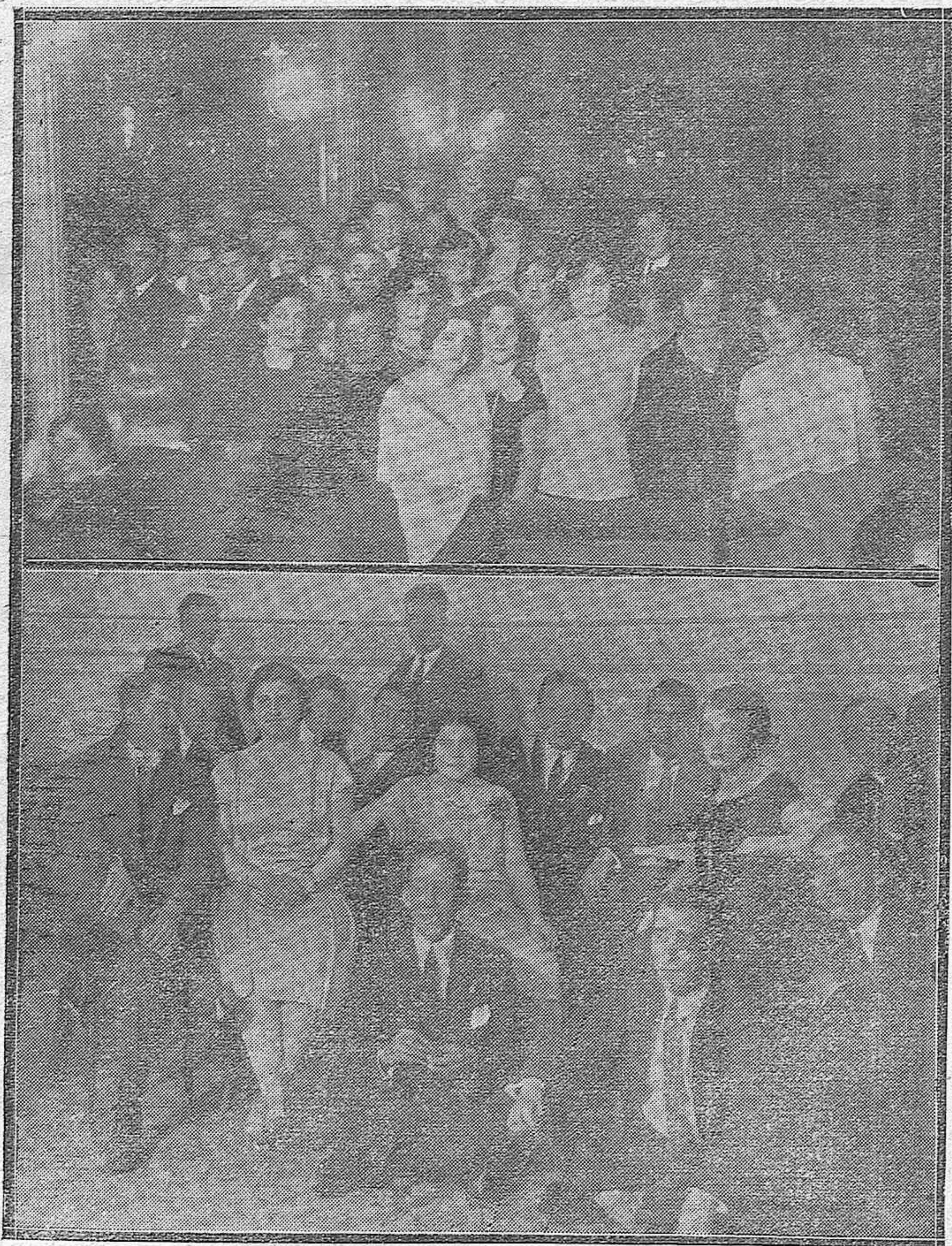
Aspecto parcial del salón del Círculo de Labradores, durante el baile de máscaras celebrado el sábado anterior.—Algunos de los concurrentes a dicho baile, en un momento de descanso.