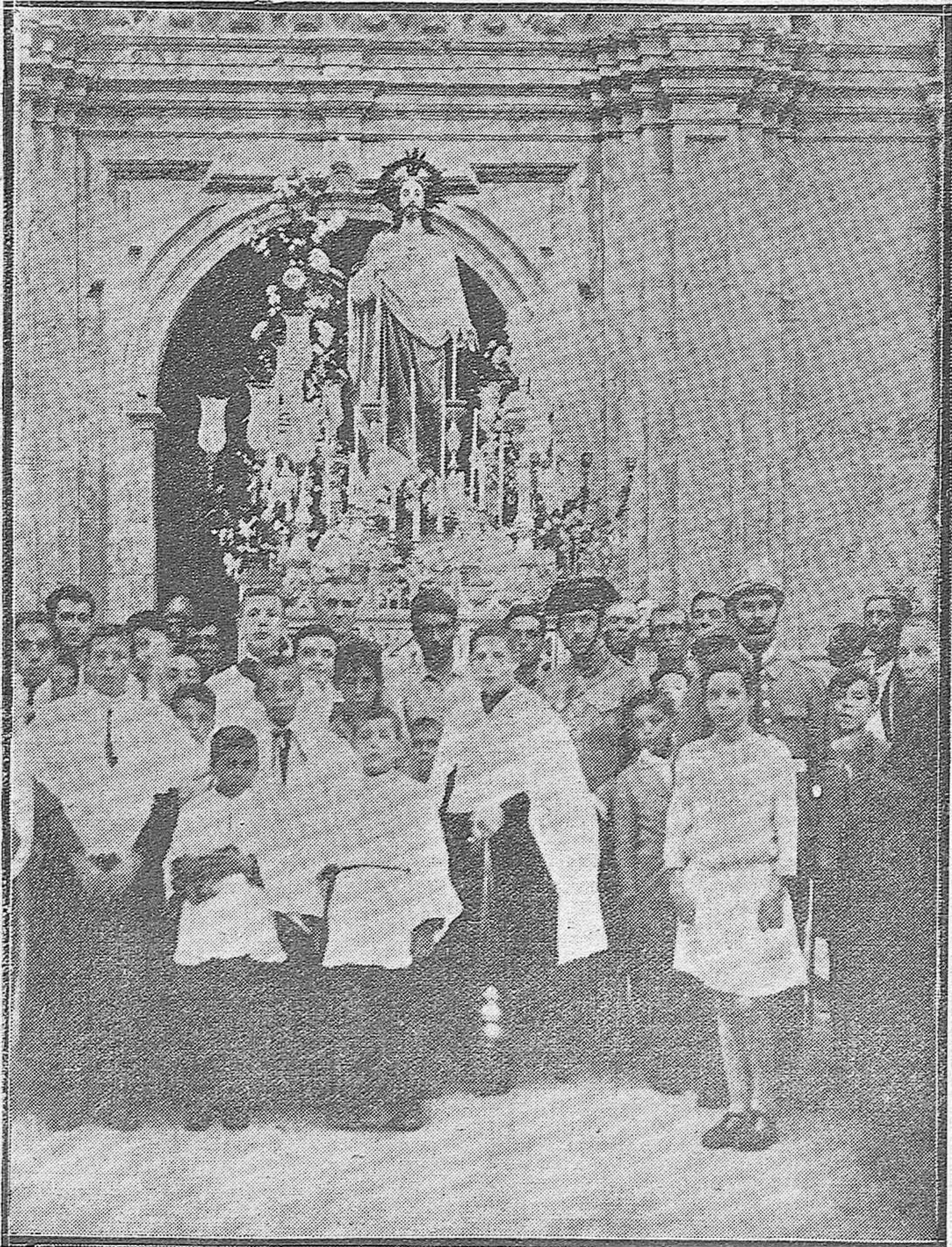
LA PROCESIÓN DEL CORAZÓN DE JESÚS.—La preciosa imagen del Corazón de Jesús saliendo de la Parroquia de San Francisco después de los solemnes cultos que le han dedicado.