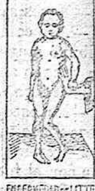
ENFERMEDAD DE LITHE