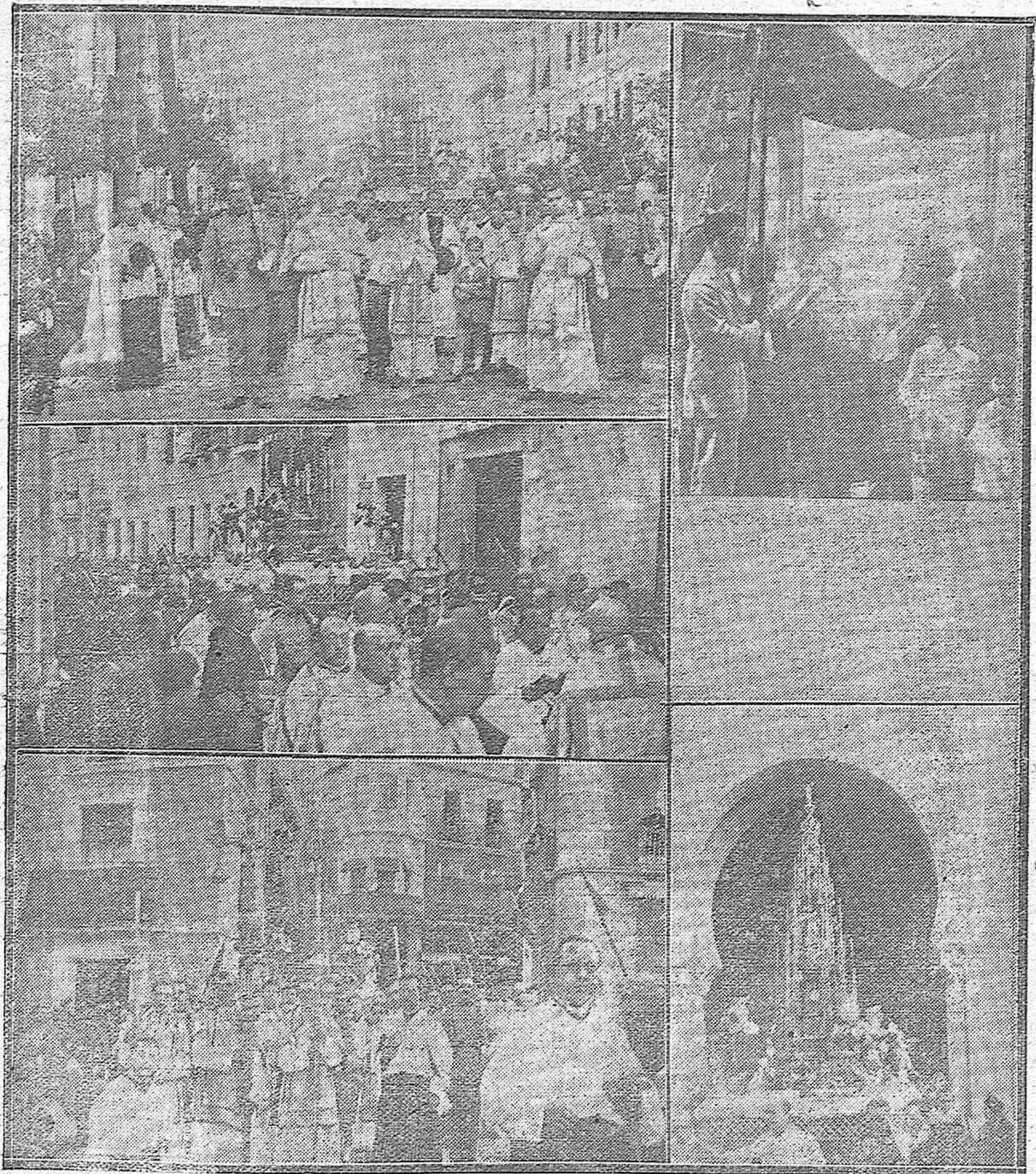
EL DIA DEL CORPUS CHRISTI.—Varios momentos de la solemne procesión después de salir de la Mezquita Catedral.—La valiosísima y artística Custodia de Arie al salir por la puerta de Santa Catalina.—Procesión que salió de San Cayetano para recorrer los patios exteriores de la residencia de los Carmelitas descalzos.