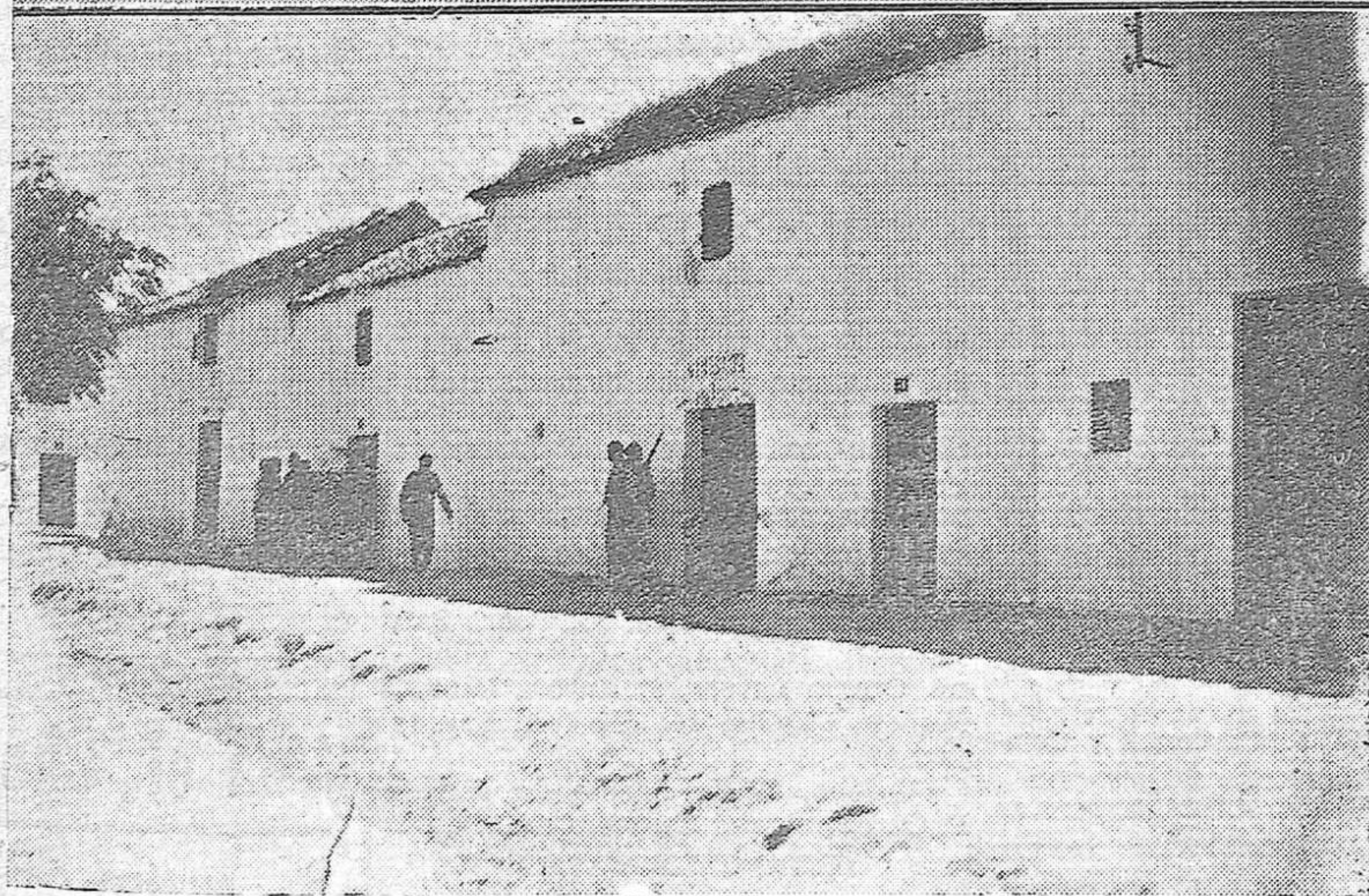
ARRIBA: Personal de la Cruz Roja, perteneciente a la sección de Córdoba, y que acompaña a la columna del general Varela en su avance sobre Málaga, prestando cura de urgencia a un herido en un combate. — ABAJO: Las fuerzas del general Varela tomaron el pueblo de Humilladero. Momentos después de entrar en él, se realizan registros para detener a los dirigentes marxistas.