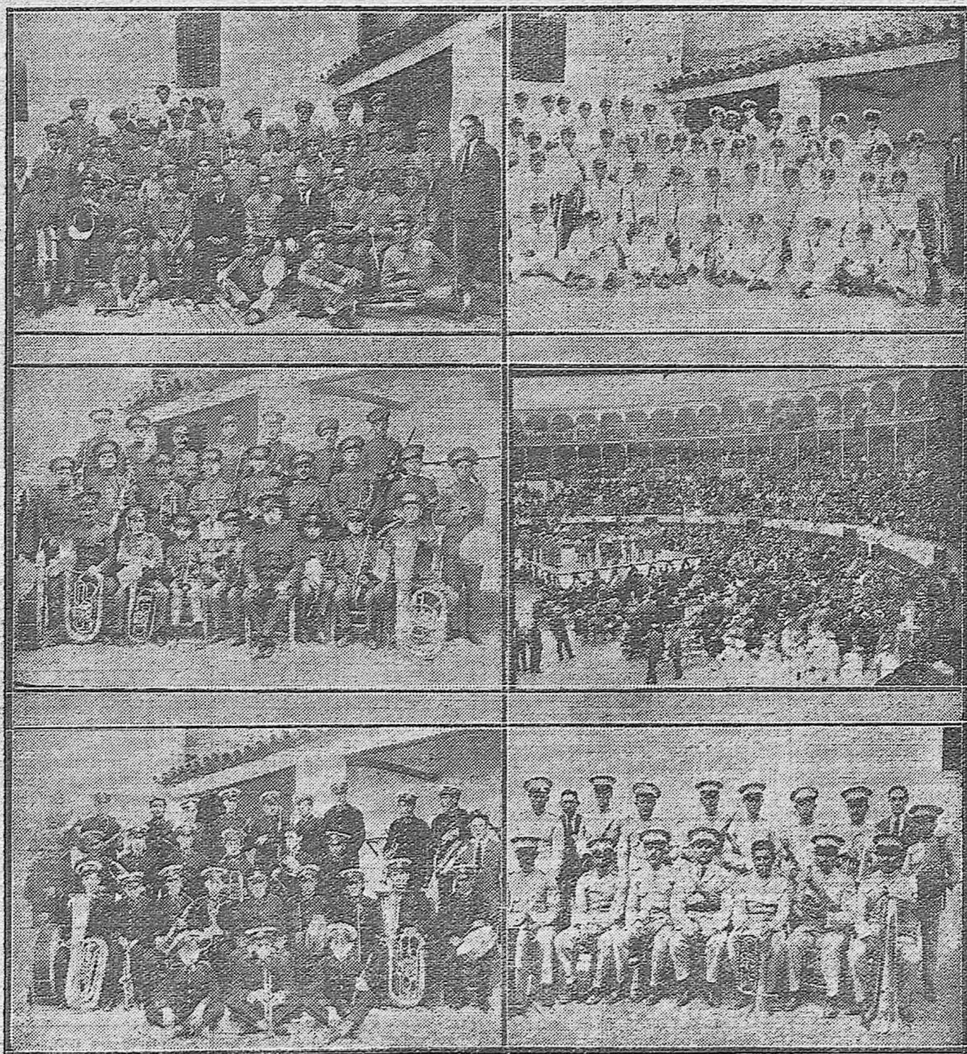
NOTAS DE LA FERIA DE LA SALUD.—Concurso provincial de Bandas Municipales de Música.—Banda de Baena que ganó el Gran Premio del Ayuntamiento.—Banda de Cabra, segundo premio.—Tercer premio la de Espejo.—Aspecto de la Plaza de Toros durante el Concurso.—Las Bandas de Lucena y El Carpio que también lograron premios.