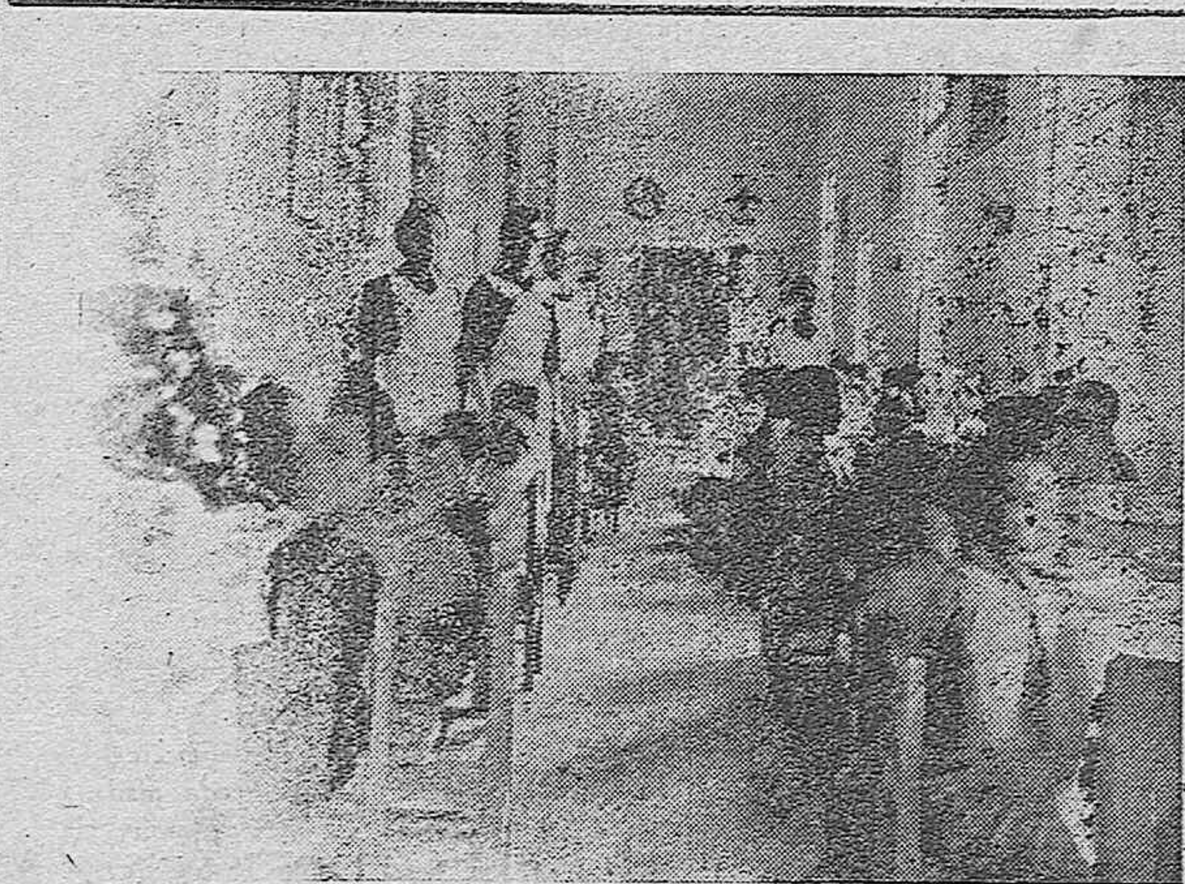
PUENTE GENIL.—El nuevo Comedor de «Auxilio Social».

Hablo impulsado por el deseo de nuestro Alcalde, como representante eclesial, por pura disciplina y confiado a vues-