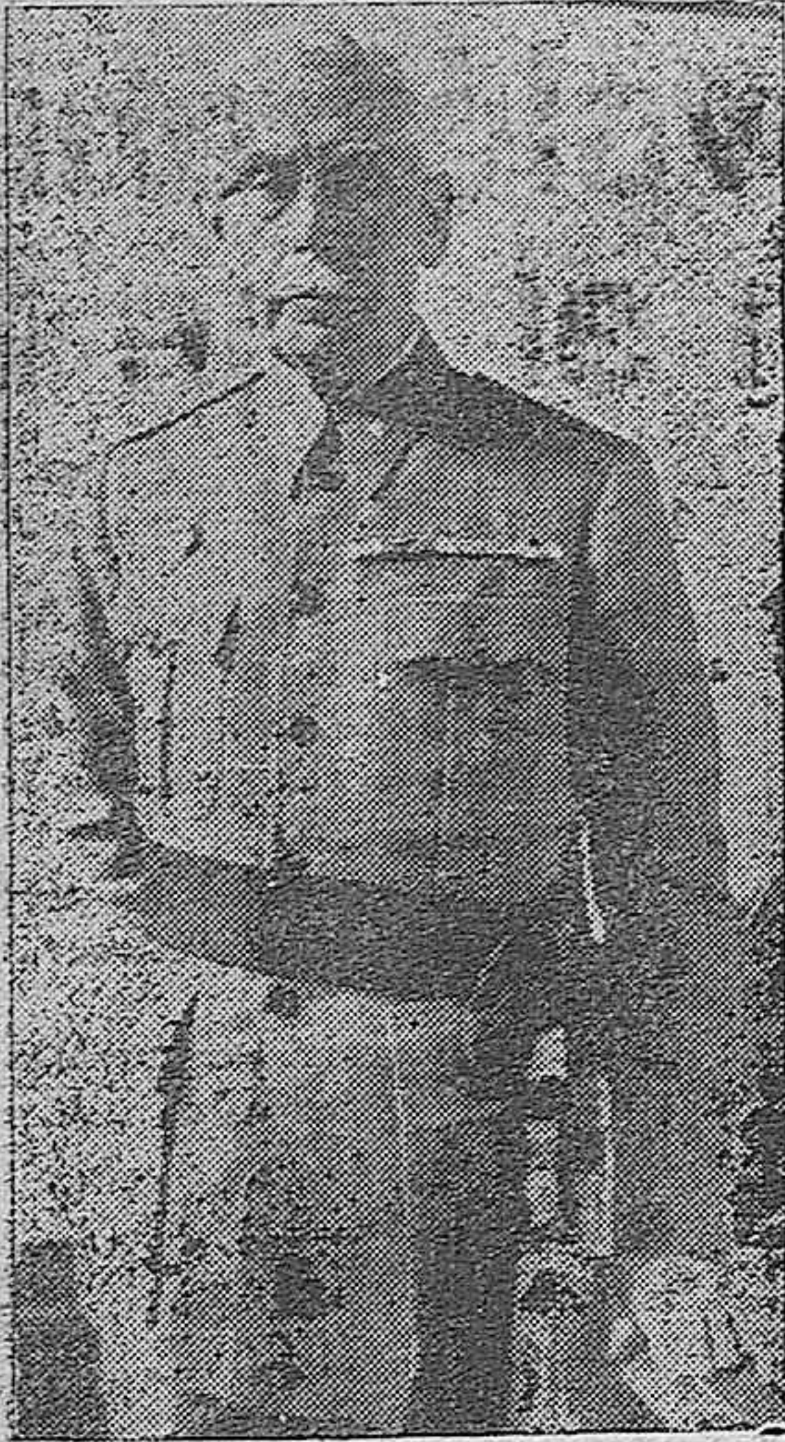
El general de brigada don Francisco Formoso Blanco, Gobernador Militar de Córdoba.