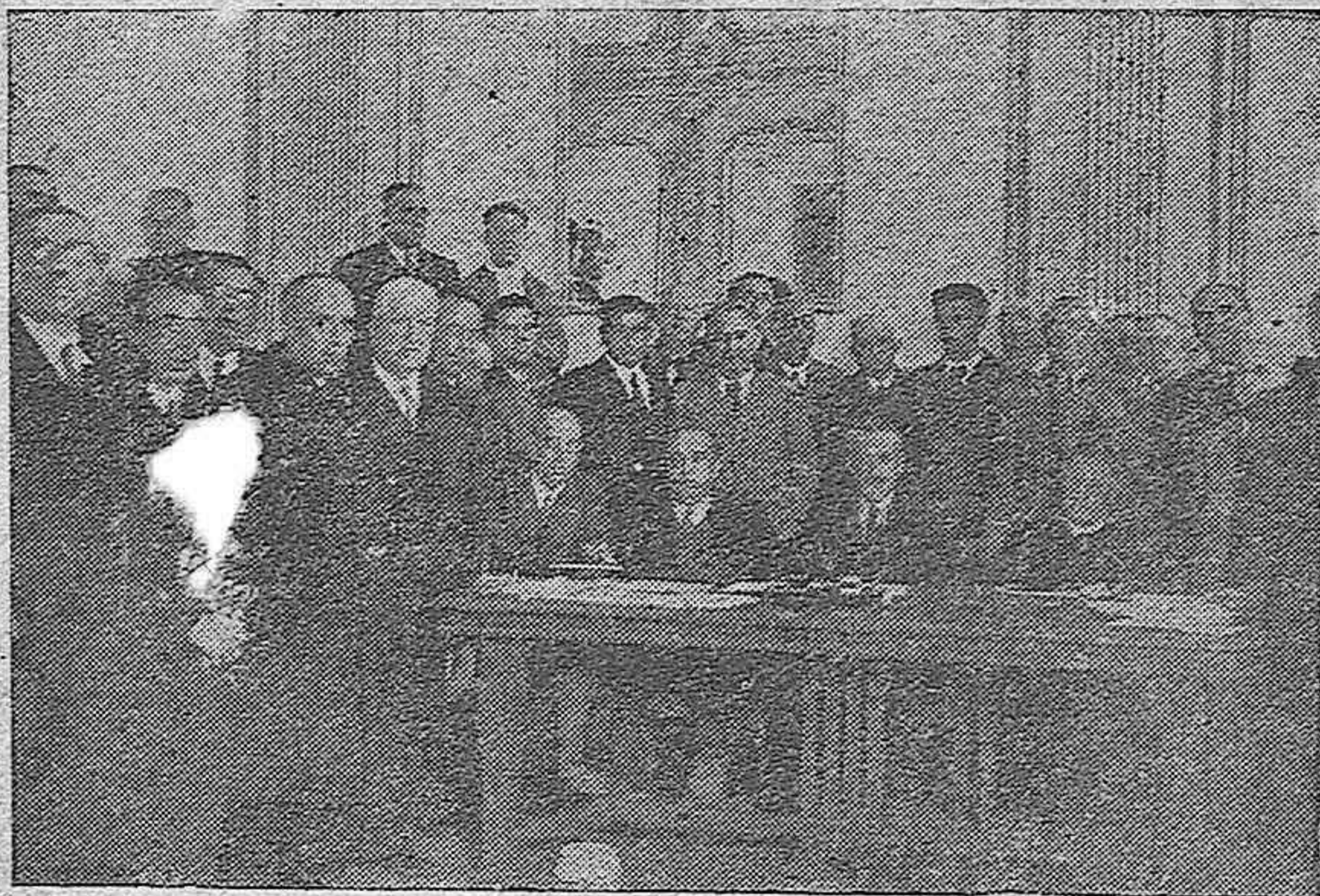
Presidencia de la Asamblea Nacional de Olivareros celebrada en Córdoba

Traemos a los mientes esta experiencia española ante el hecho sintomático que ofrece la literatura británica en momentos tan graves como los que atraviesa el mundo. Durante la guerra de mil novecientos catorce, todos los escritores franceses, incluso aquellos que como Francia se encontraban a muchos estados de la sensibilidad patriótica de su pueblo, vibraron en una idéntica emoción por la defensa del país. Ahora Inglaterra no ve en su tierra este fenómeno unitario. No nos remitimos exclusivamente al caso de Bernard Shaw, cuyo paradjismo tradicional pudiera exculparle de su postura abiertamente hostil contra el Imperio. Pero el mismo caso se reproduce en Chesterton y en la generalidad