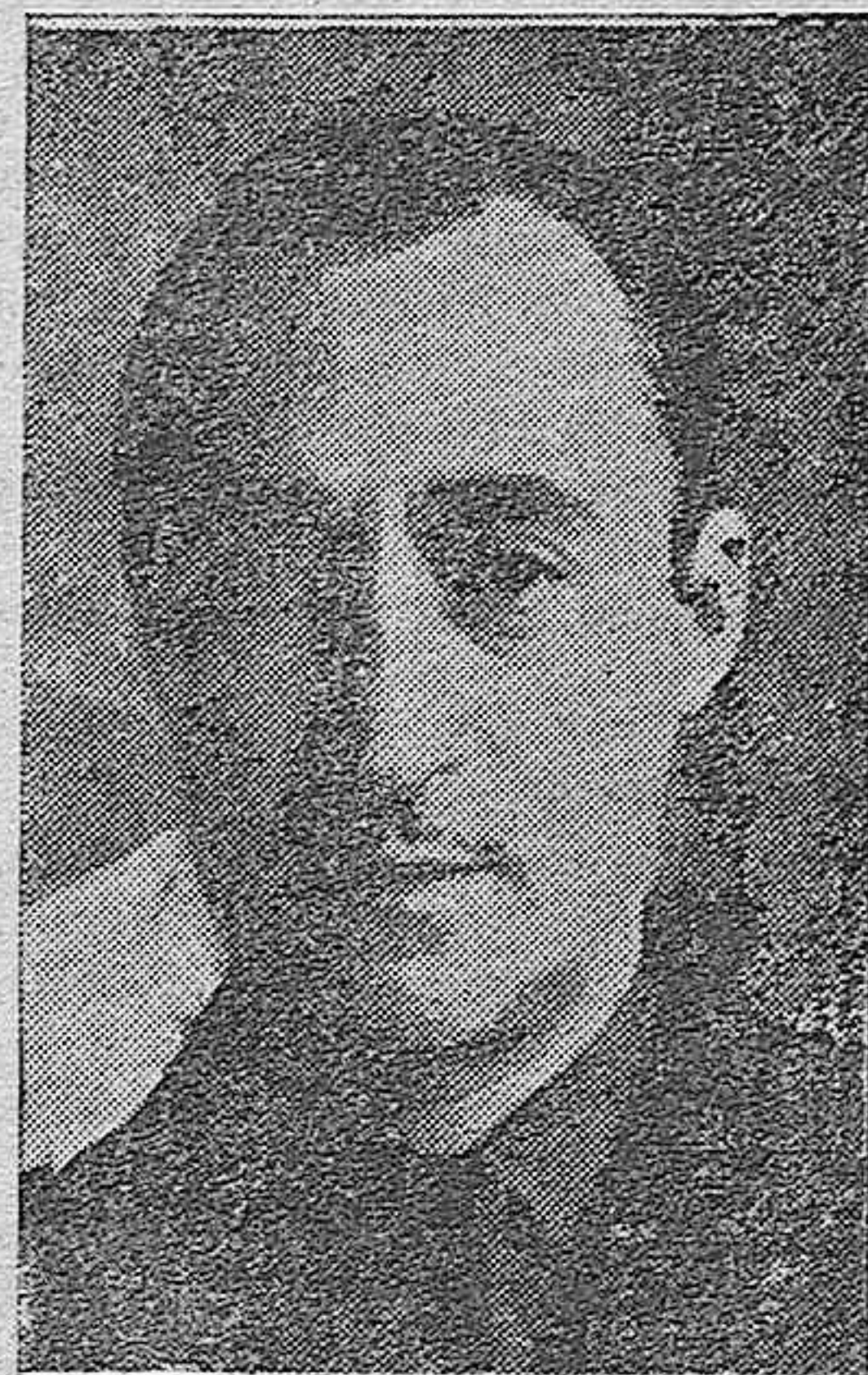
MIGUEL PRIMO DE RIVERA, MIEMBRO DE LA JUNTA POLITICA