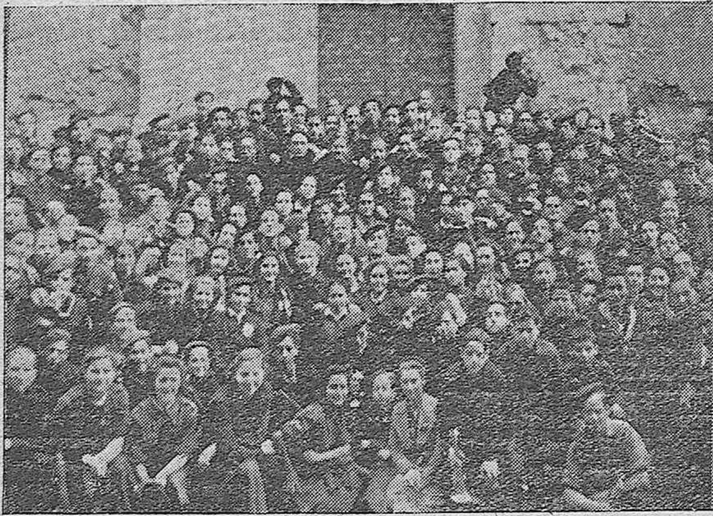
Un grupo de camaradas de la O. J. de Ceuta, Tetuán y Larache, que visitaron la Mezquita-Catedral, durante su estancia en Córdoba.

Hoy se cumple el primer aniversario de la muerte en el frente de batalla de este bravo falangista, perteneciente al Batallón de Cazadores de Melilla número 3.