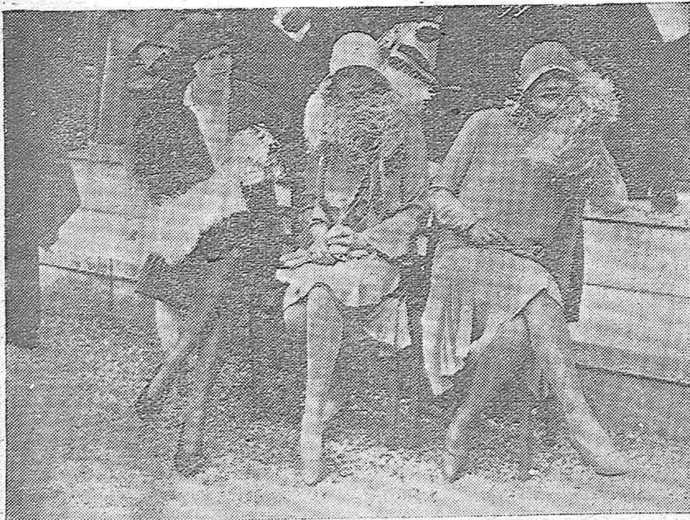
LAS MODAS DE OTOÑO EN PARÍS.—TRES LINDÍSIMAS «MANEQUINES» LUCIENDO LOS ÚLTIMOS FIGURINES EN LA «PELOUSE» DE LONGCHAMPS.