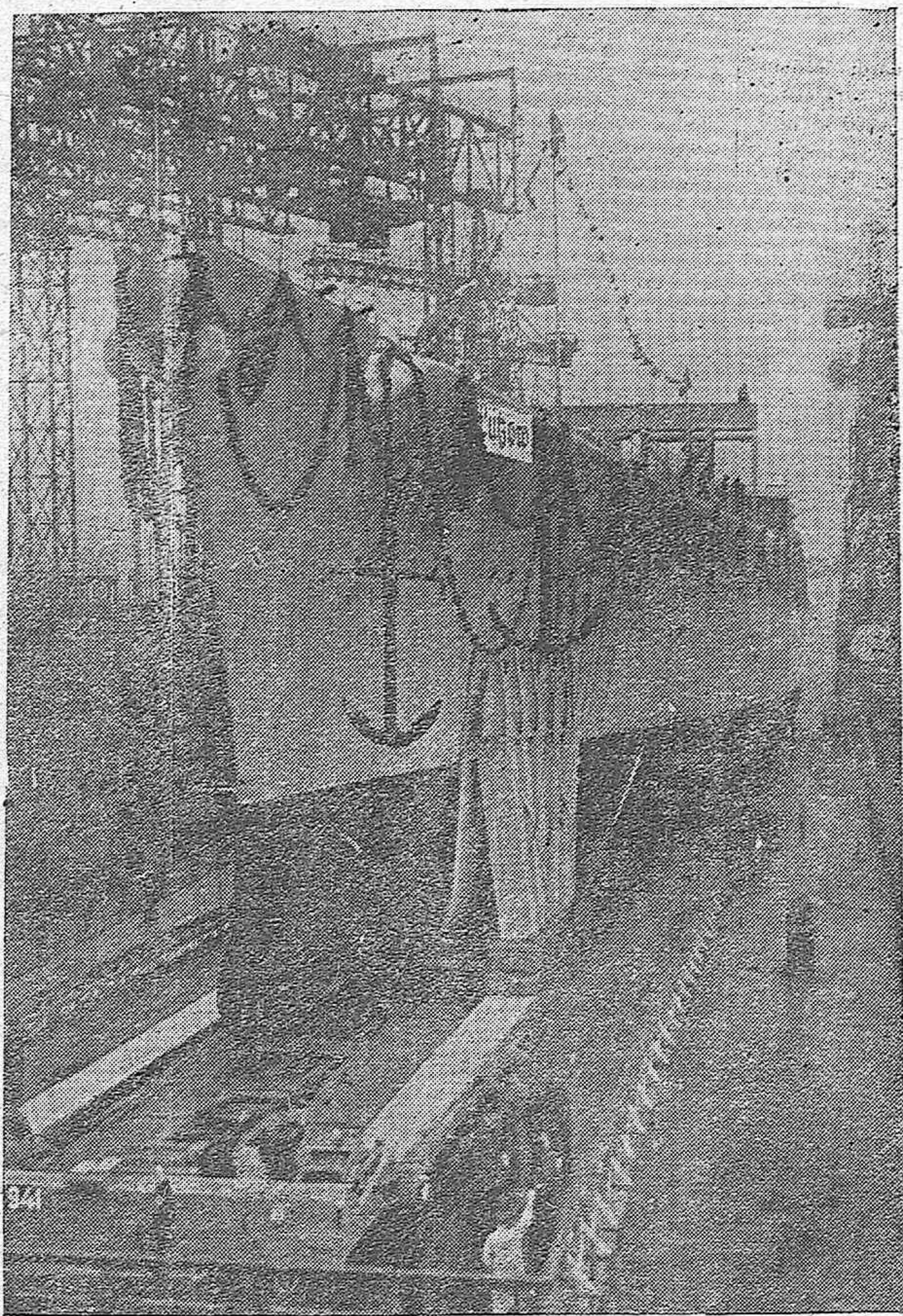
LANZAMIENTO DE UN NUEVO CRUCERO ALEMÁN EN BREMEN.—En Bremen fué botado al agua el nuevo crucero alemán «Lutzow», quinto de la serie de 10.000 toneladas.