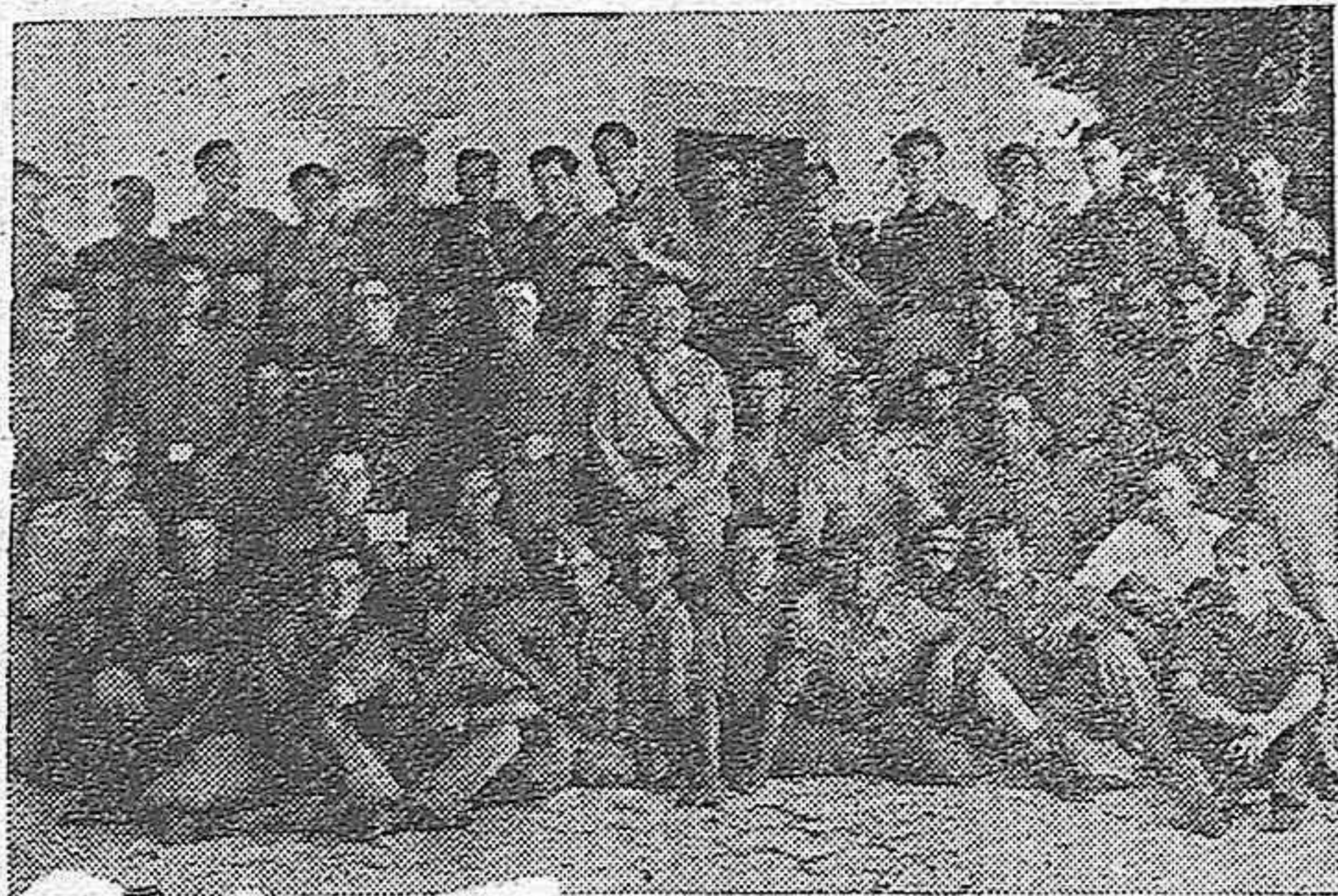
LA FESTIVIDAD DE SANTIAGO APOSTOL, PATRON DEL ARMA DE CABALLERIA.—En el Cuartel del Marrubial, Depósito de Remonta y Cria, se celebraron diversos actos los días 24 y 25, con motivo de la solemnidad de Santiago.—Un grupo de fuerzas, después del rancho extraordinario servido a la tropa.

Daremos la batalla a la miseria y «los que más tienen darán un poco en beneficio de los que no tienen nada».