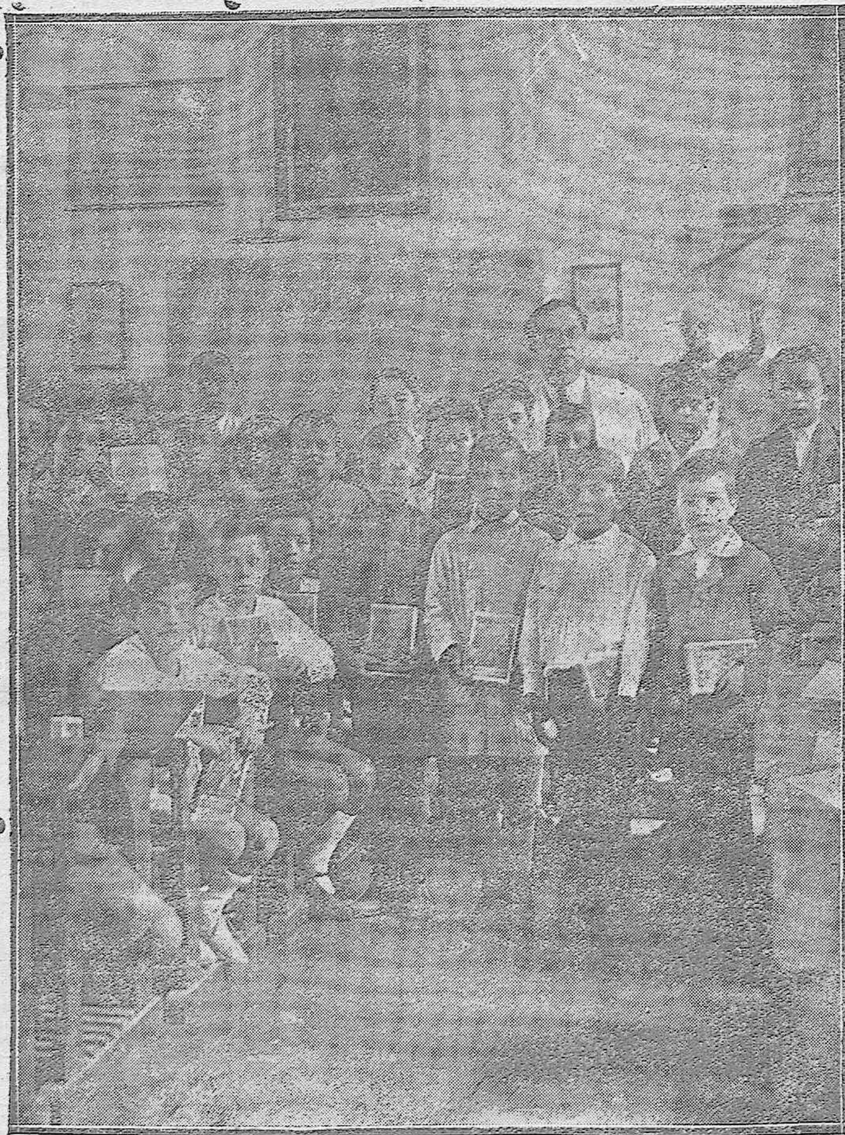
Alumnos seleccionados de todas las escuelas nacionales de Córdoba, del cursillo de verano dado por el inspector-jefe de primera enseñanza en el Club de Niños, a quienes el Ayuntamiento ha regalado con el libro «España sobre todo».