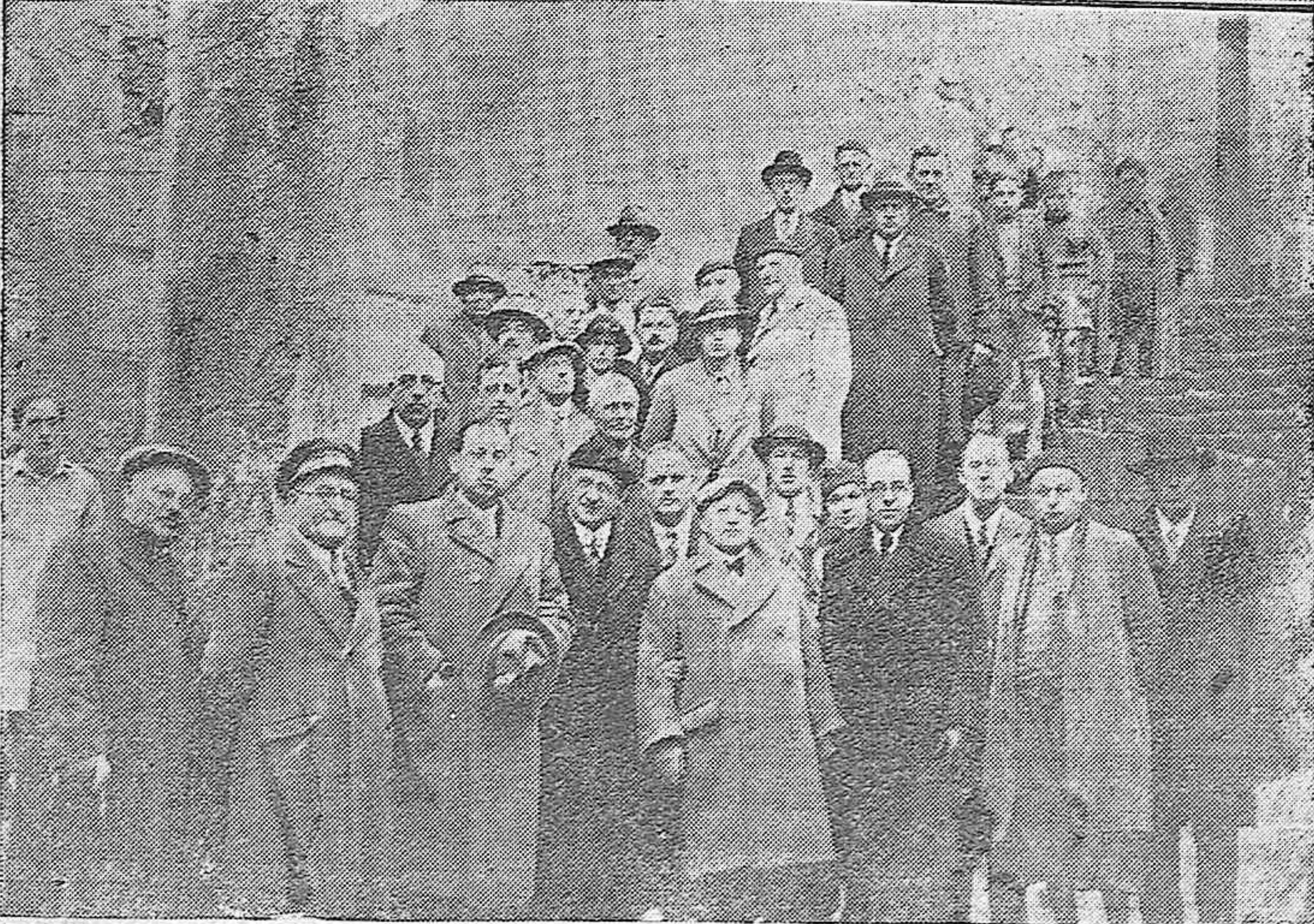
Los miembros del Congreso Internacional Antialcohólico durante la visita al Ayuntamiento de Córdoba, donde se celebró una recepción en su honor.—Los congresistas visitando los monumentos históricos de la ciudad