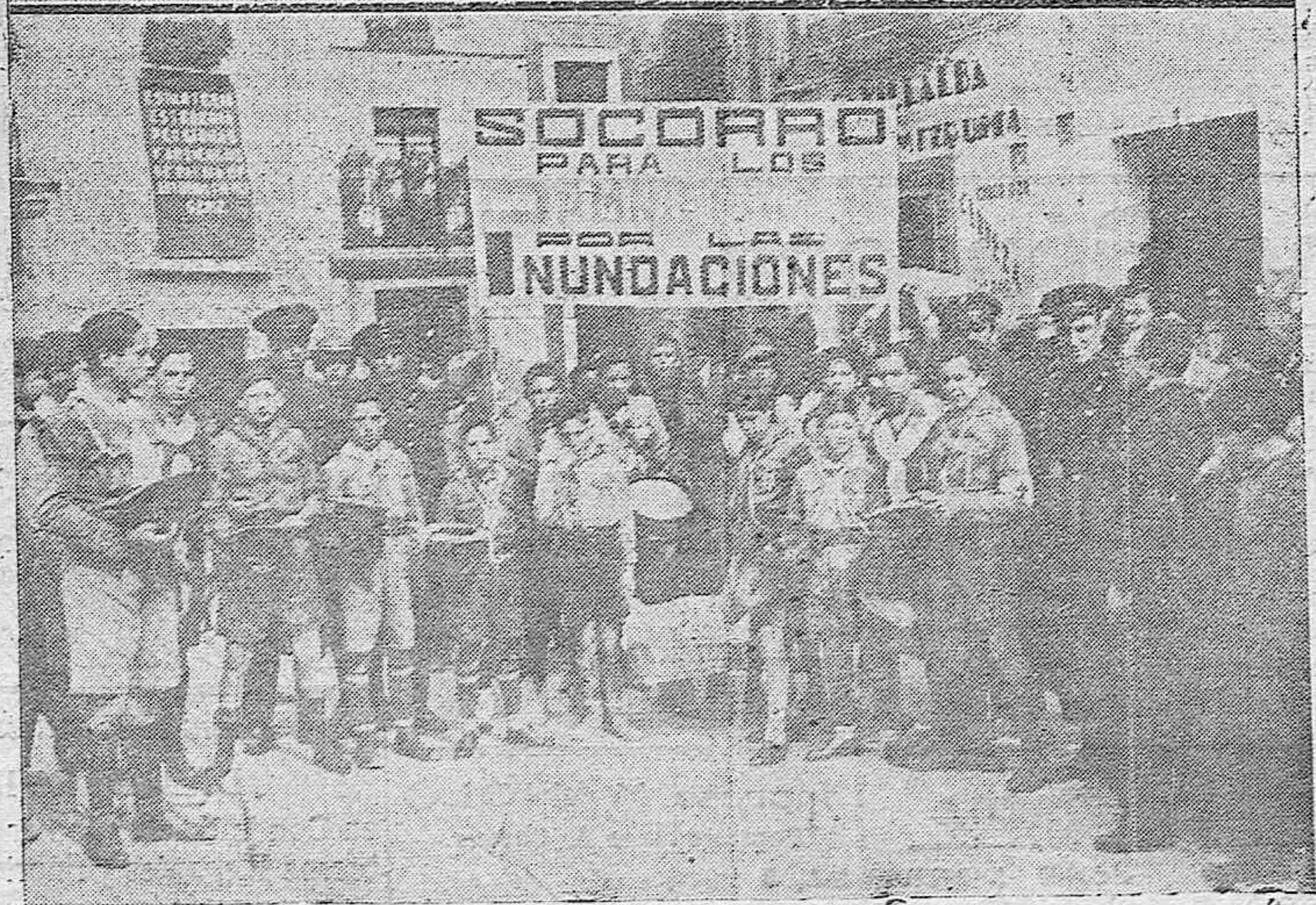
Bellas señoritas formando una simpática comparsa que tomaron parte en la fiesta de la Piñata.—Los exploradores cordobeses postulando por las calles de la capital para los damnificados a causa de los últimos temporales. (Fotos Santos).