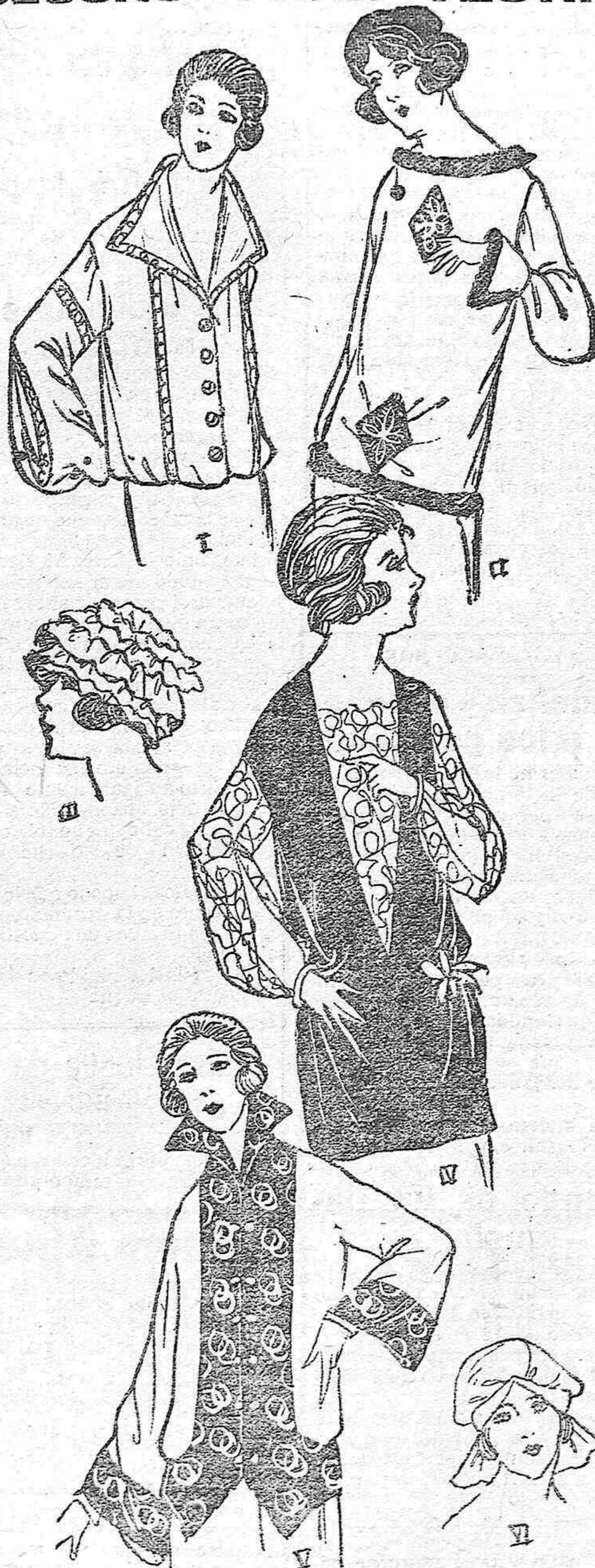
He aquí, queridas lectoras, un delicioso conjunto de blusas y de pequeñas cofias.