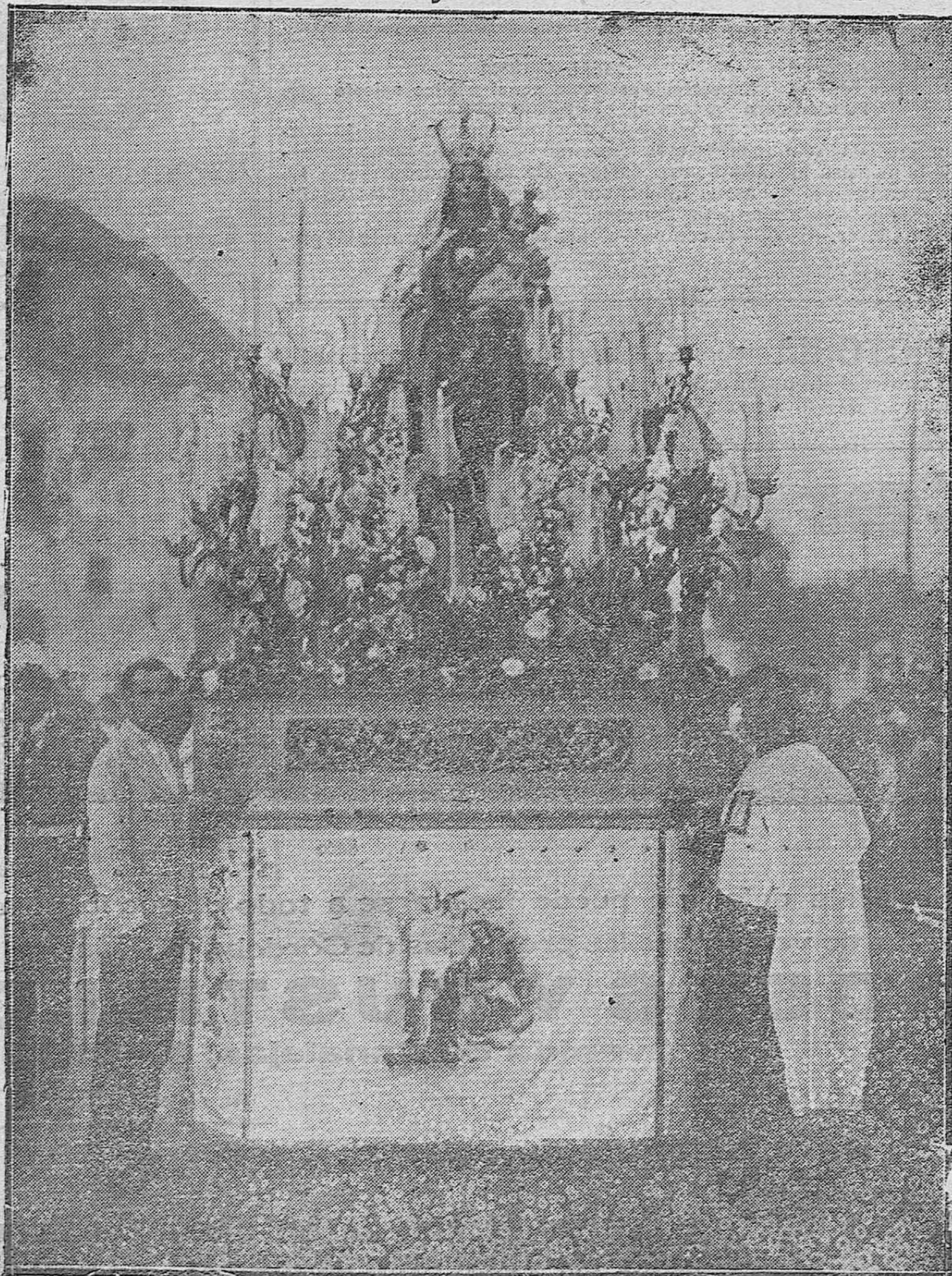
LA IMAGEN DE LA VIRGEN DEL CARMEN QUE FUE SACADA AYER PROCESIONALMENTE DE SU IGLESIA DE LA PUERTA NUEVA.