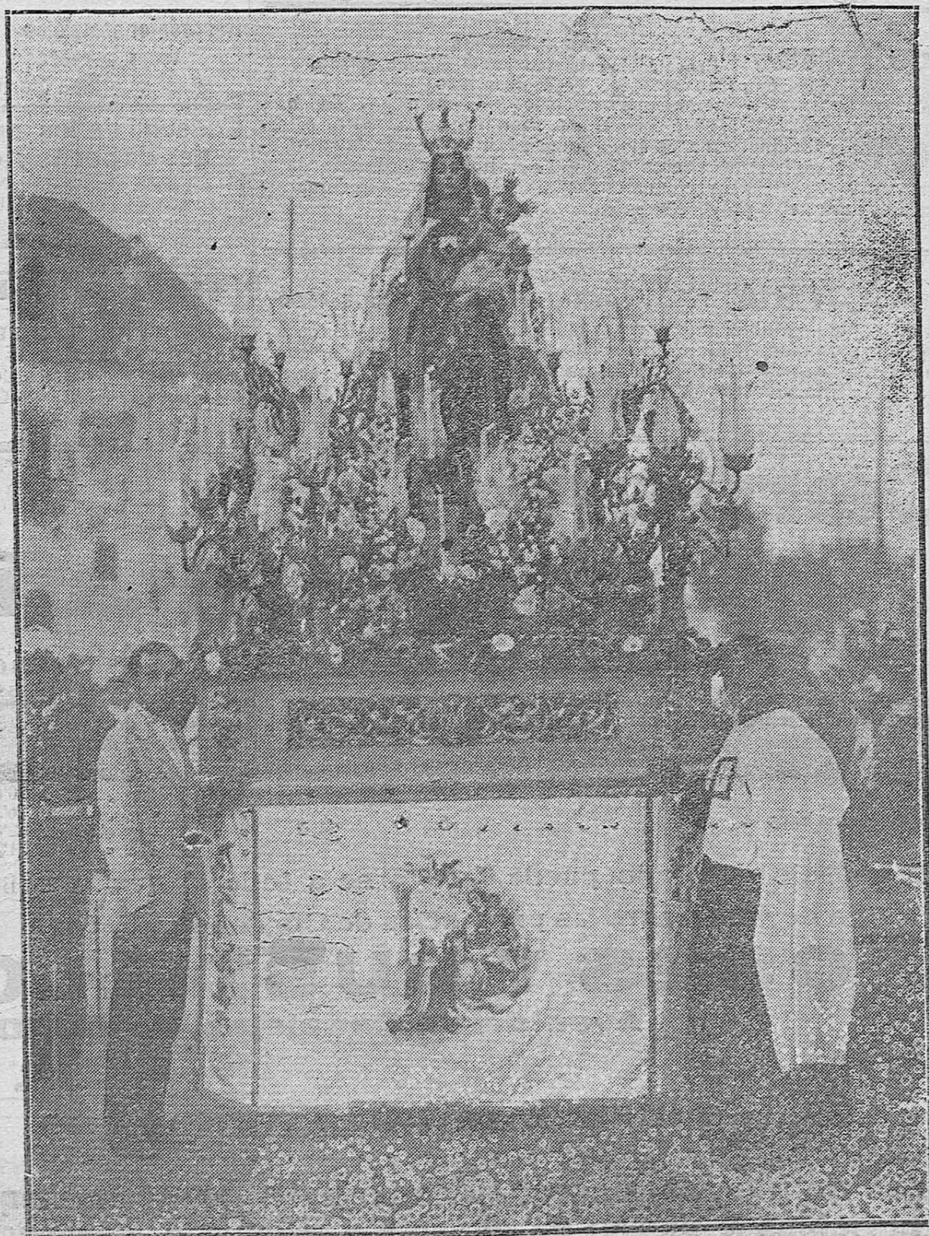
LA IMAGEN DE LA VIRGEN DEL CARMEN QUE FUE SACADA AYER PROCESIONALMENTE DE SU IGLESIA DE LA PUERTA NUEVA.