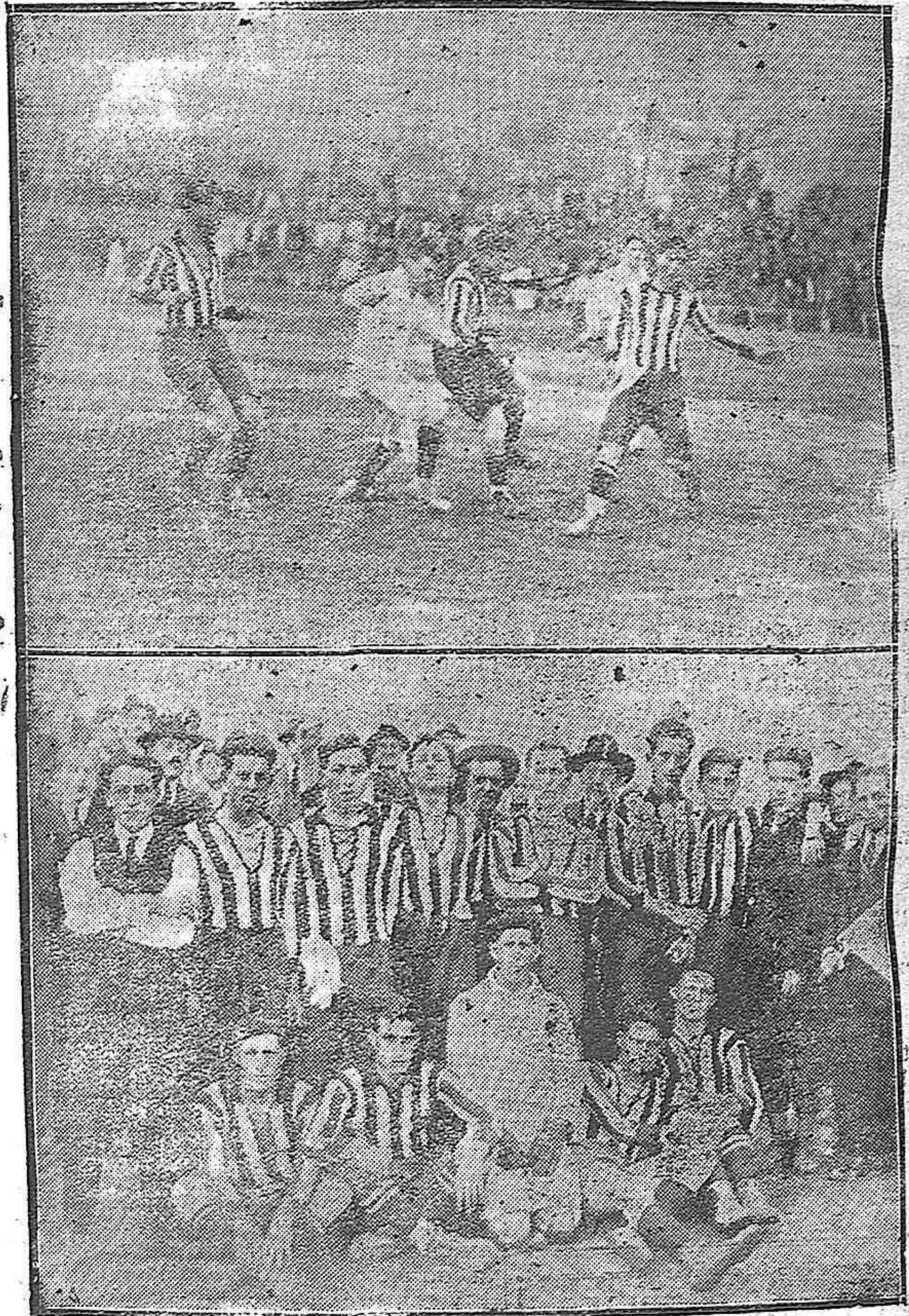
UN MOMENTO INTERESANTE DEL PARTIDO DE AYER. EL TEAM DE RIO TINTO F. C. QUE EMPATÓ CON EL LOCAL A UN TANTO.

Estos se marcaron un goals en un buen avance del ala derecha que centrando bombeado, quiso despejar el referido Roales, introduciéndolo en su red de un falso cabezaso; suerte que tuvieron ellos.