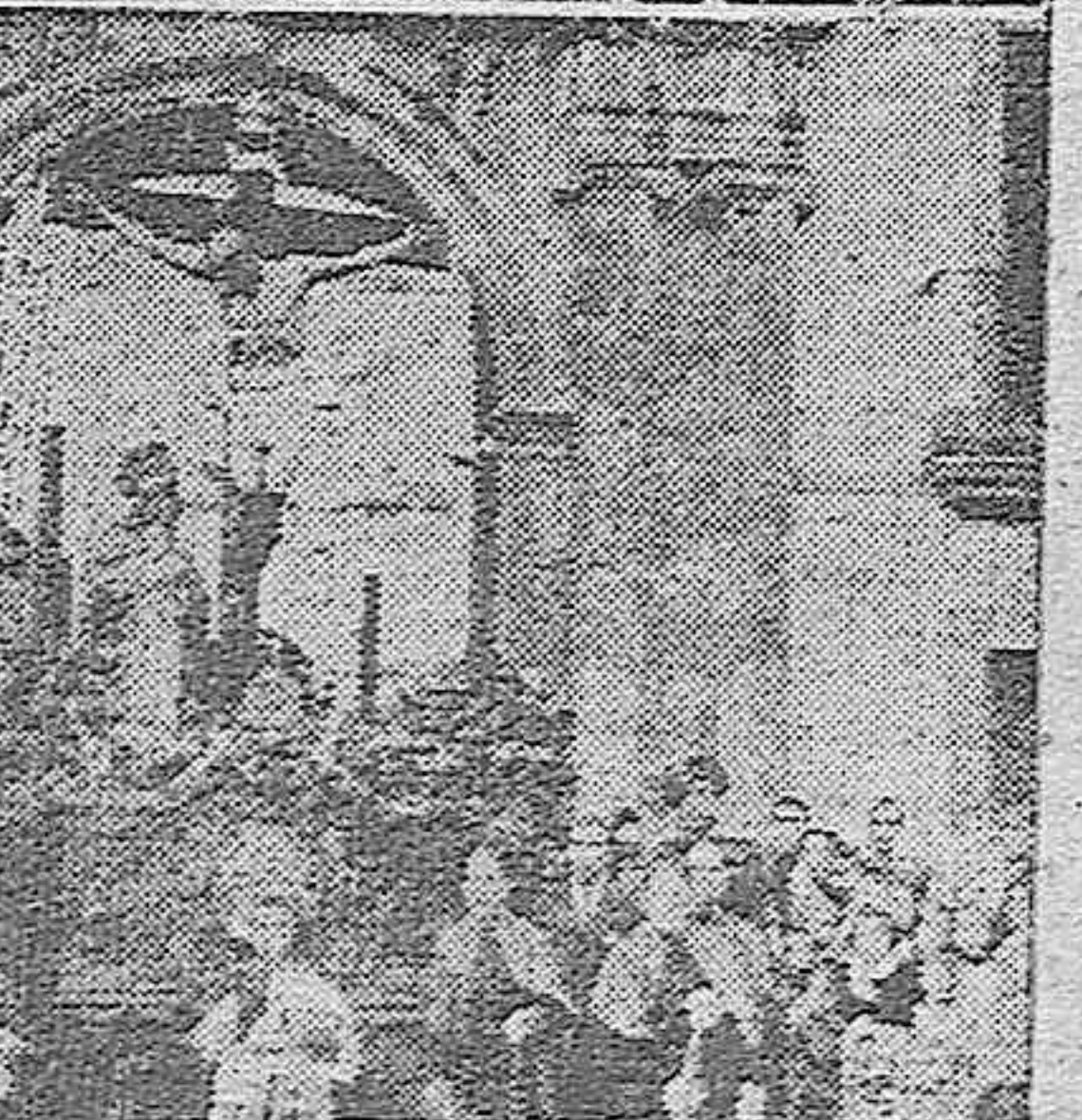
A la solemne procesión de las Palmas, celebrada por la mañana, sucedió en la tarde la de las cofradías cordobesas, que llenaron las calles de religioso fervor.