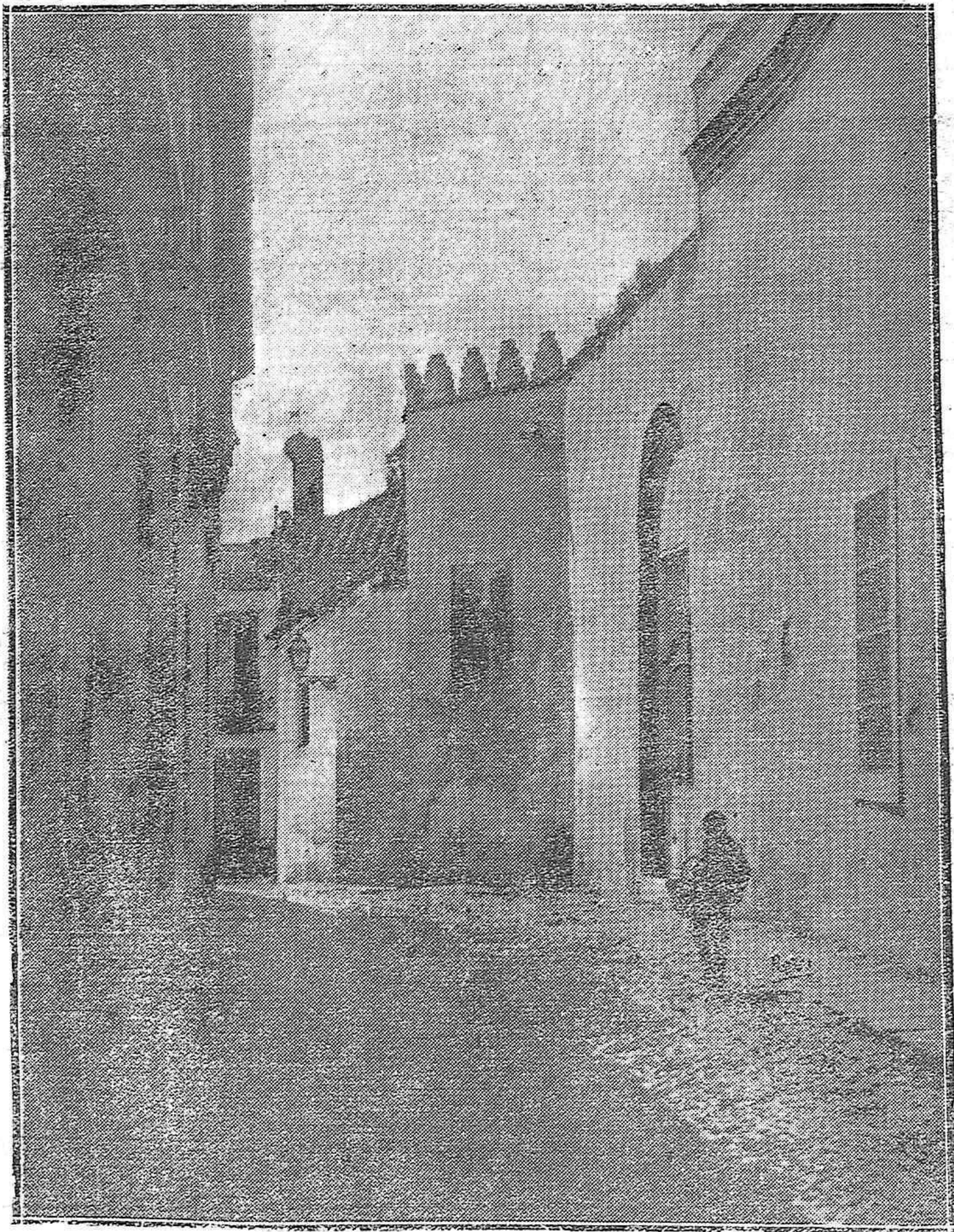
CÓRDOBA.—PORTERIA DE SANTA CLARA.