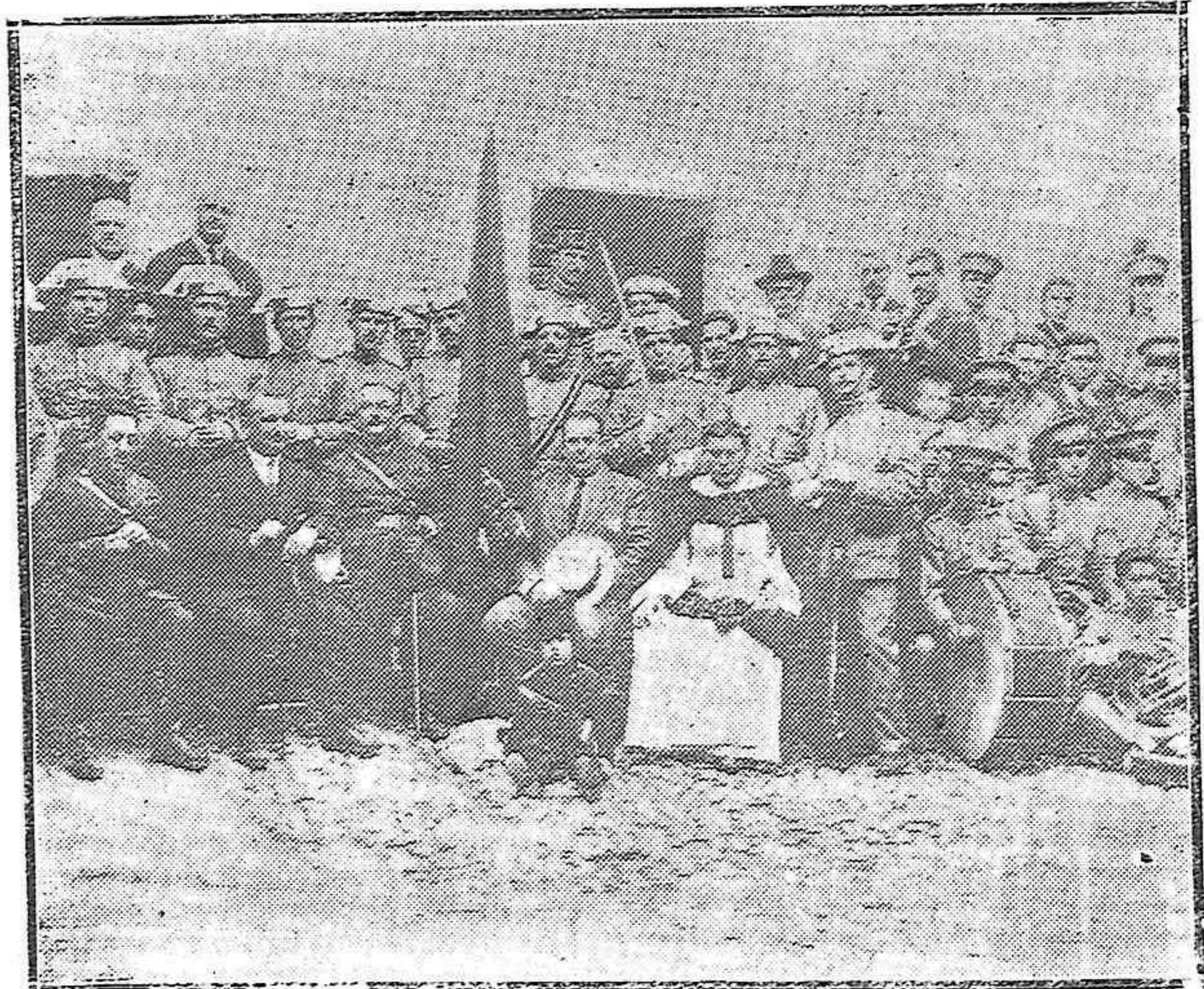
VILLA DEL RIO.—ACTO SOLEMNE DE ENTREGARSE POR LAS AUTORIDADES LA BANDERA A LA GUARDIA CIVIL DE AQUELLA VILLA.

Por estímulo del precio comprará usted en EL METRO sin necesitar nada; hay siempre artículos de ocasión y retazos.