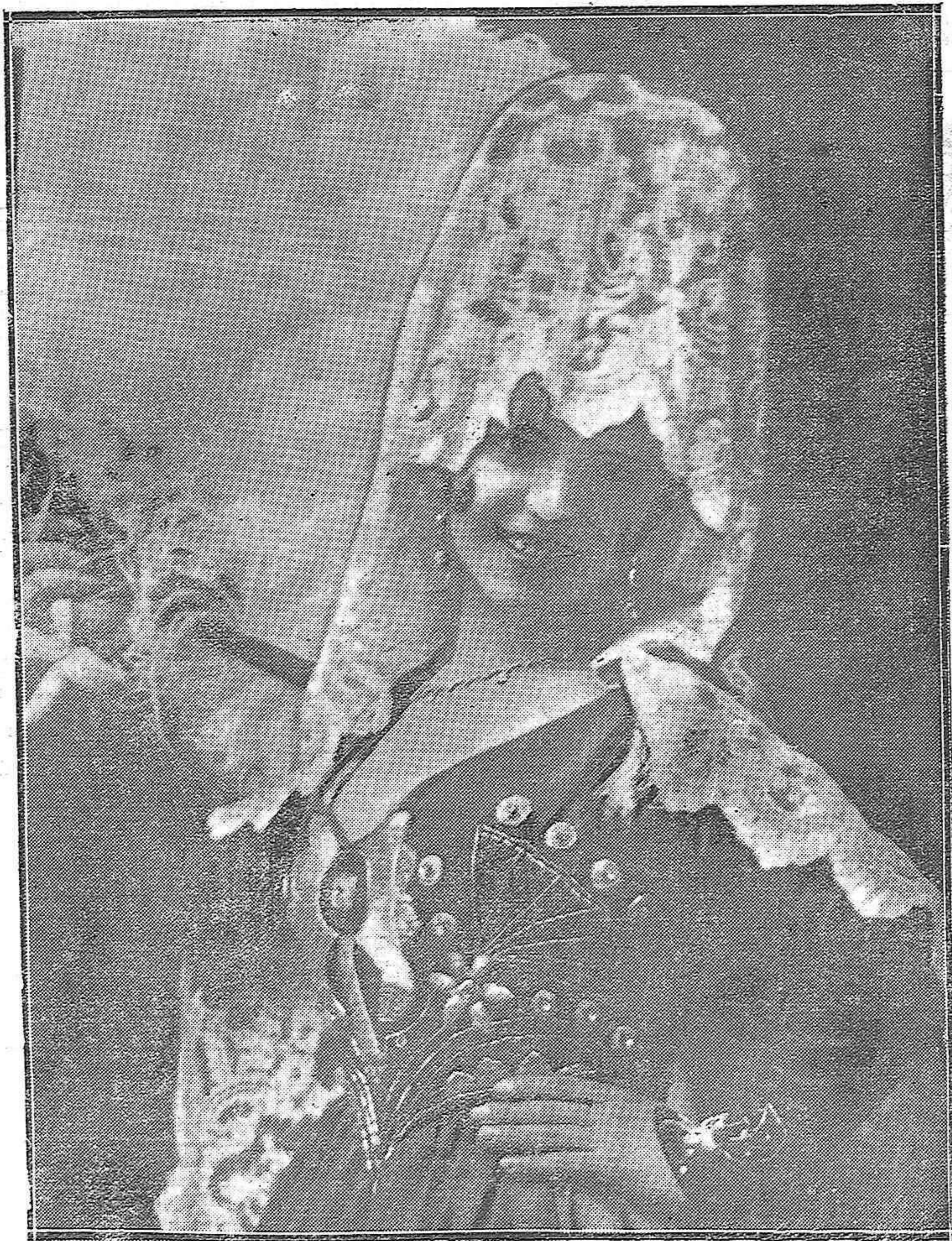
PILAR SATURNINI, TIPLÉ CÓMICA DE LA TOLUENSE "ESPAÑA."