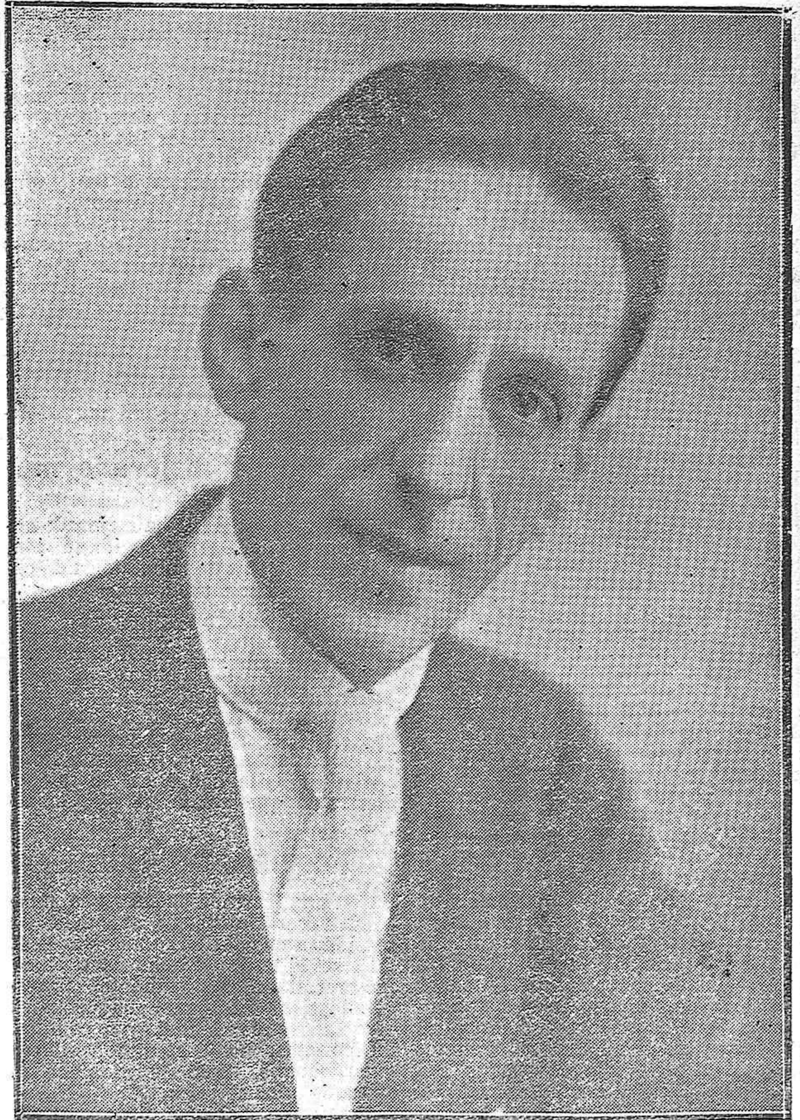
EL NOTABLE ACTOR CÓMICO ALFREDO GUILLÉN, DE LA TOURNÉE "ESPAÑA" QUE ACTÚA CON EXTRAORDINARIO ÉXITO EN EL SALÓN RAMÍREZ.

EN VISTA ALEGRE 142, OFICINAS: VELAZQUEZ BOSCO, 4