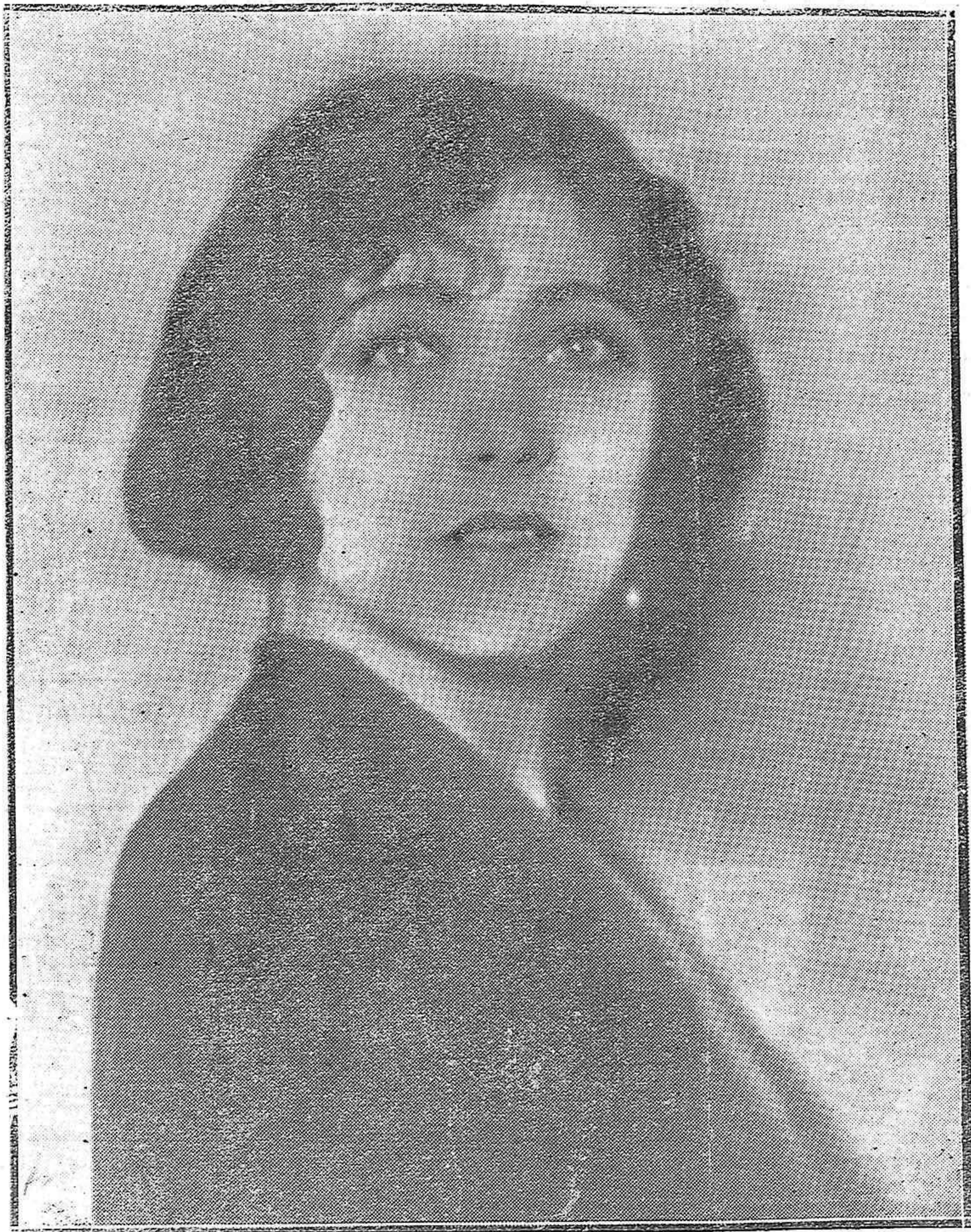
MISS ADORÉ, OTRA DE LAS PRINCIPALES ARTISTAS CINEMATOGRAFICAS DE LA COMPANIA DE "FILM" QUE SE ENCUENTRA EN CÓRDOBA.