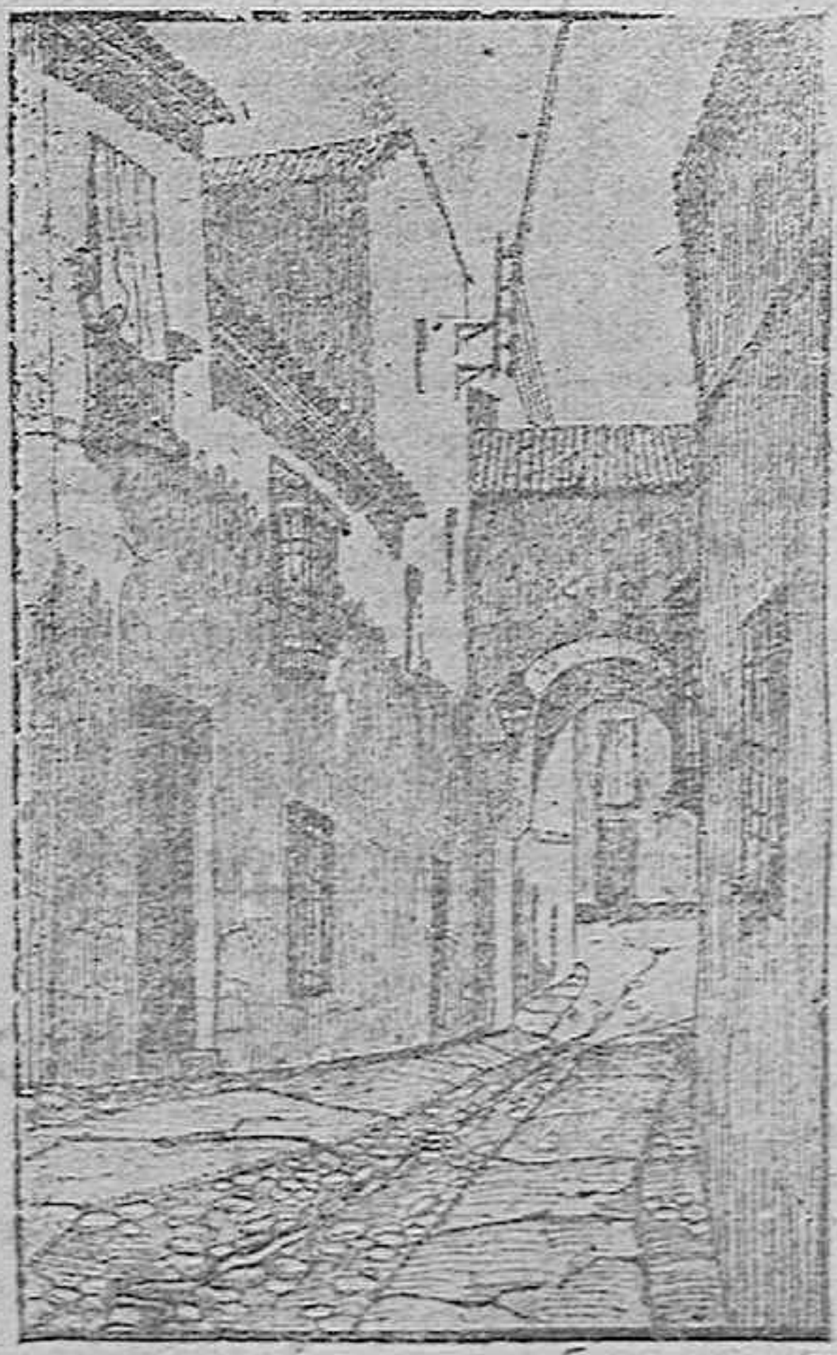
Una calle de la ciudad