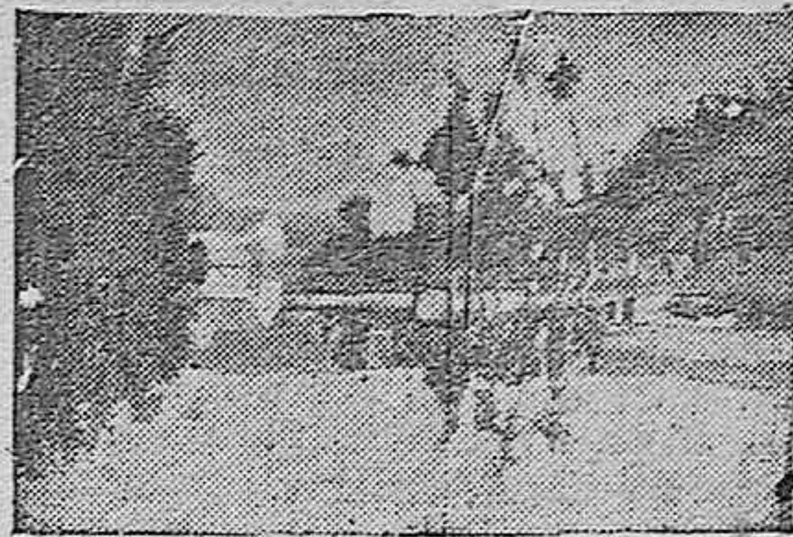
El río Guadajoz que riega las fértiles huertas de Castro del Río