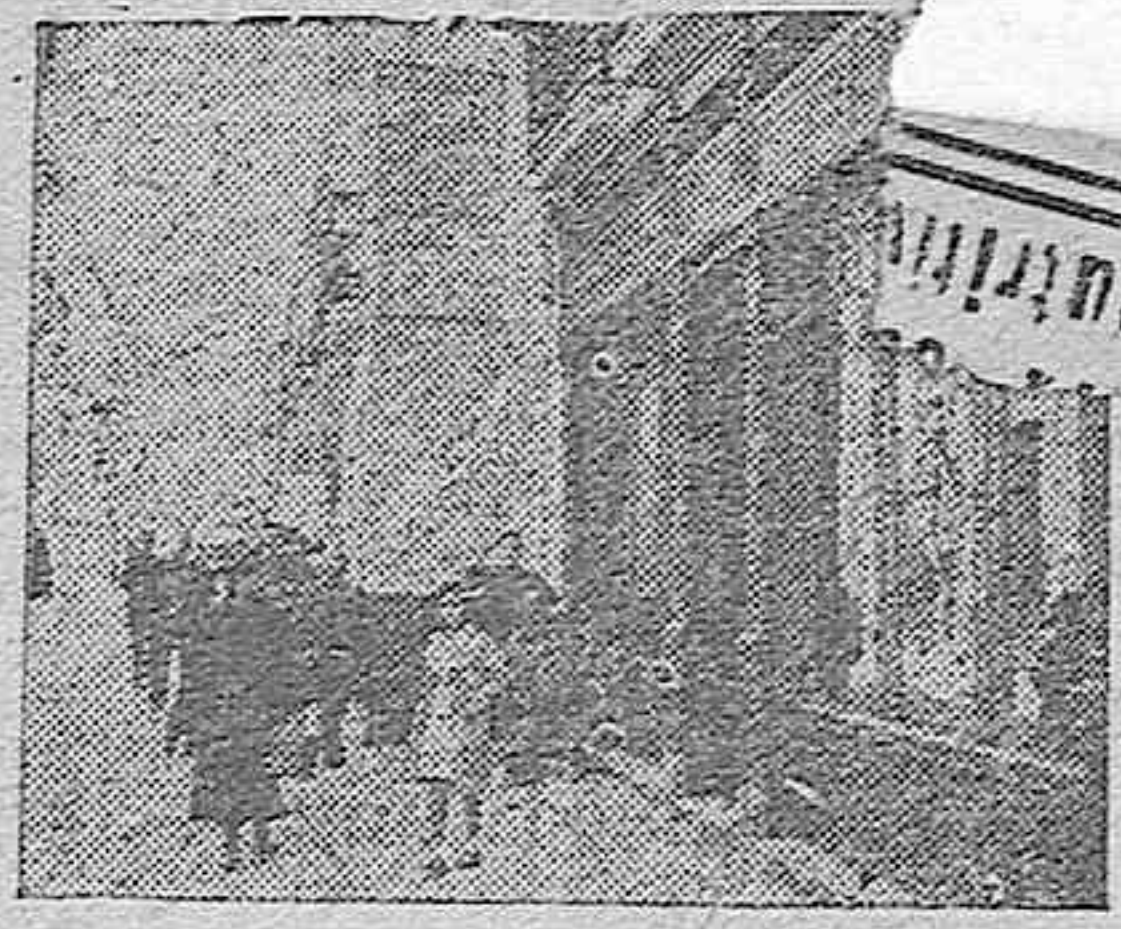
Córdoba: Un aspecto de nuestra calle Gondomar

Figuran además en la relación de obras ejecutadas el año 1940, la continuación de alcantarillado de la Prisión Provincial; Barriada de Casas Económicas de la Ciudad Jardín; Huerta de María Luisa; Segunda calle de la Huerta de Cardosa; ampliación de las Casas Consistoriales, (para lo cual se adquirieron dos casas) y arreglo y consolidación de la Ronda de la Manga y camino del Brillante al cañito de Bazán.