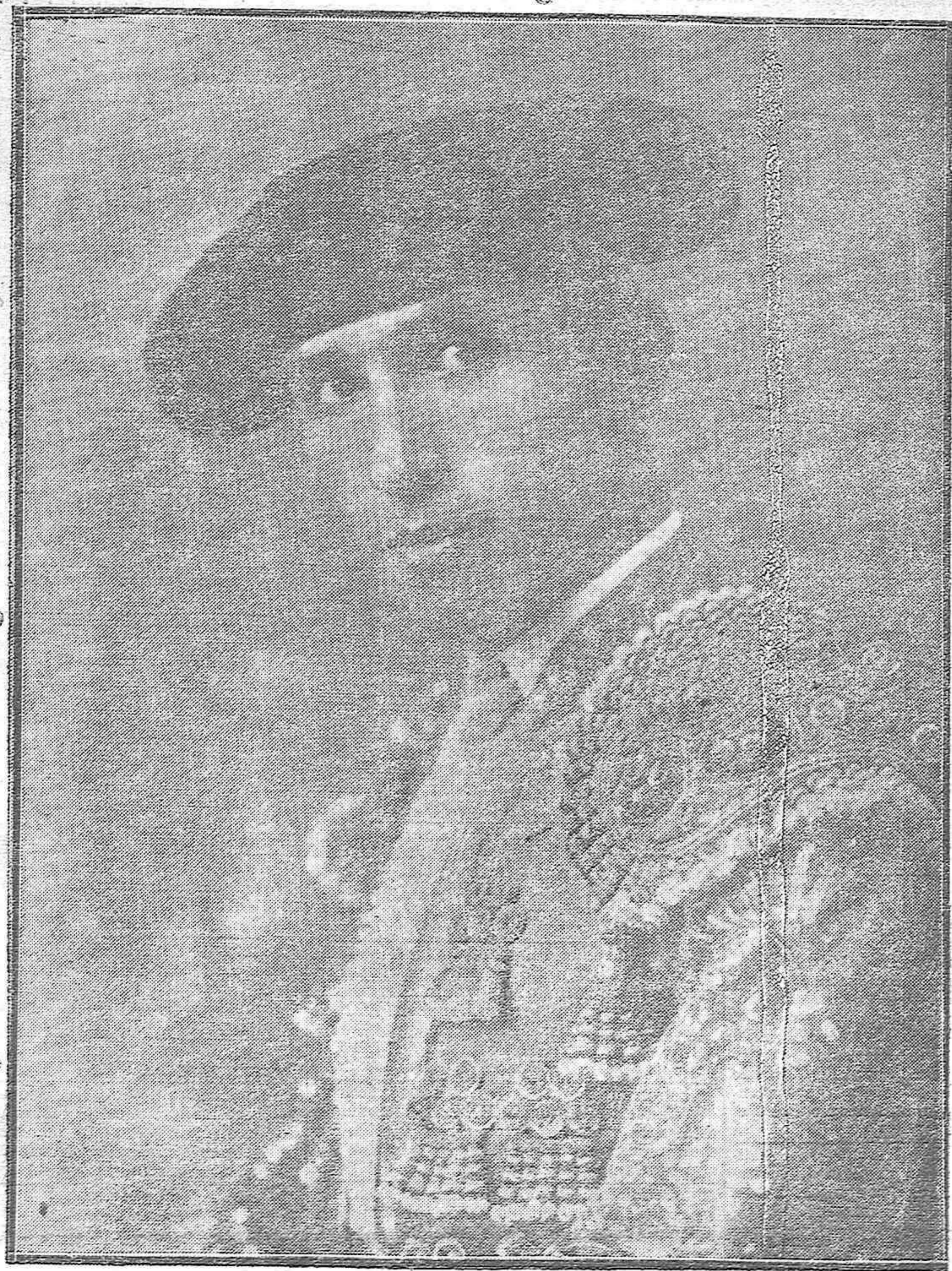
El malogrado matador de toros Juan Anillo "Nacional III", víctima de la brutal agresión ocurrida en Soria cuando se celebraba una corrida.