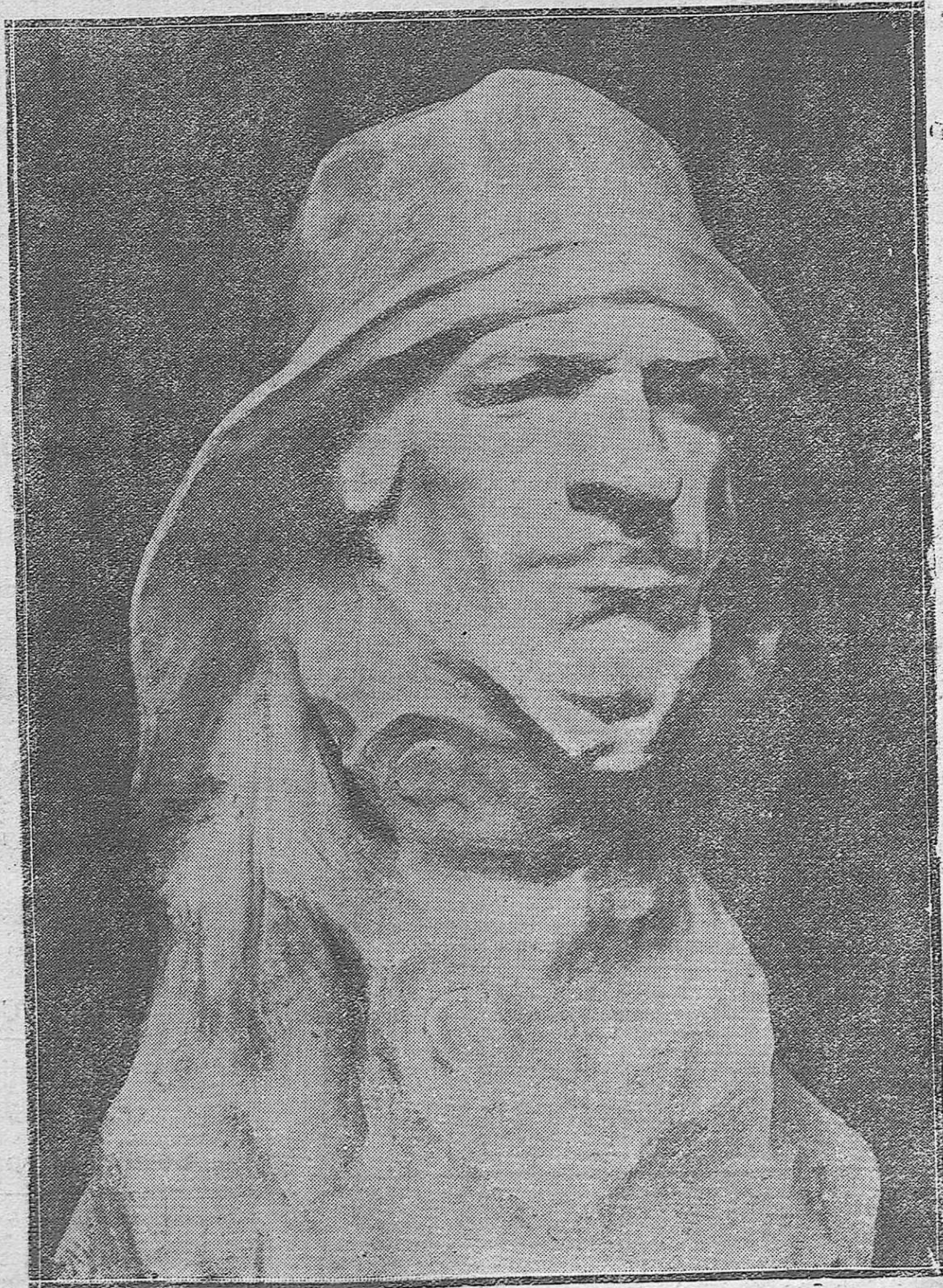
DE LA EXPOSICIÓN INURRIA.—Marino mercante.