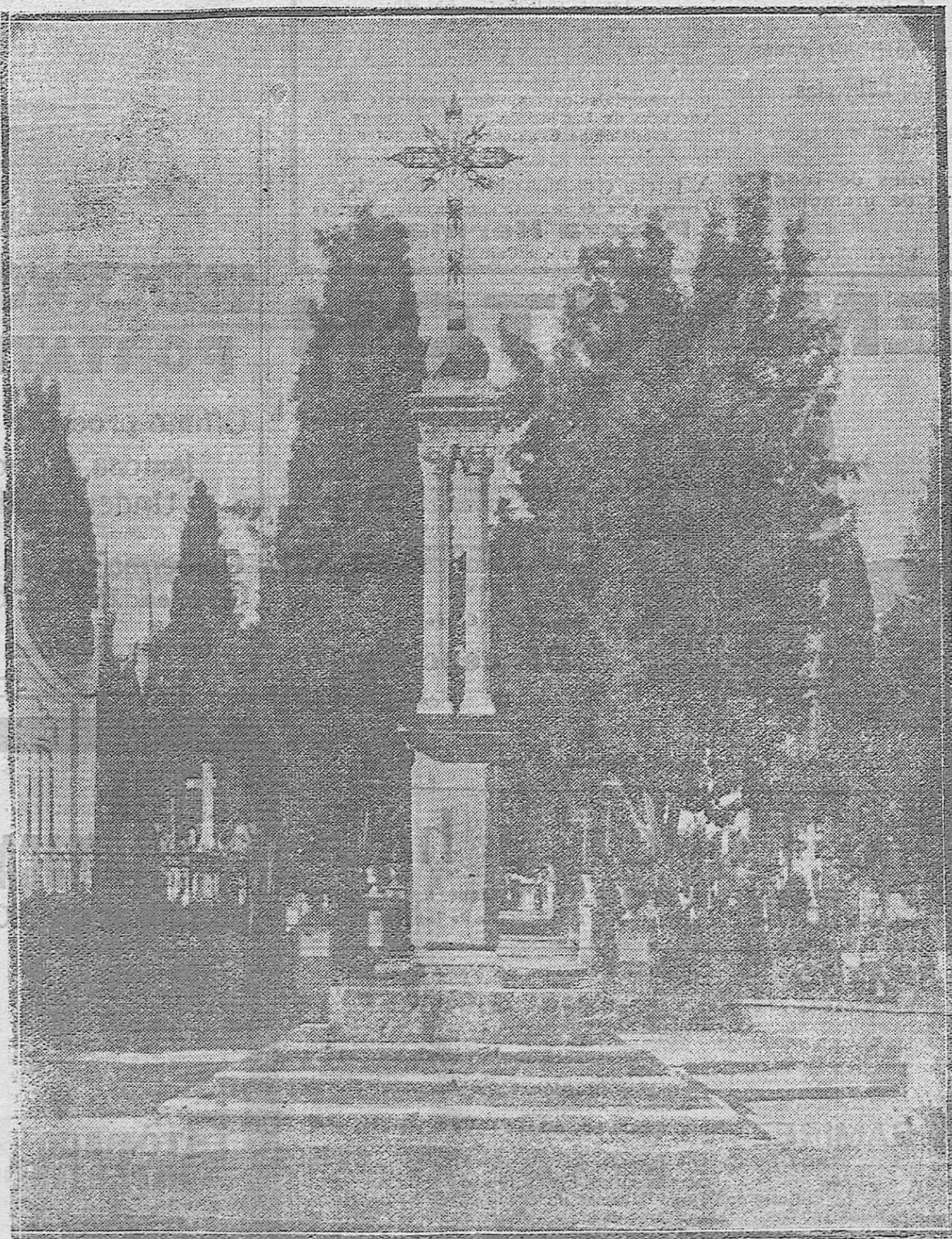
EL SEVERO MONUMENTO QUE SIMBOLIZA EN PIEDRA, HIERRO Y BRONCE «LA REDENCION DEL MUNDO POR LA CRUZ» Y QUE PRESIDE LA «CIUDAD DE LOS MUERTOS» DE LA PARTE OCCIDENTAL DE CÓRDOBA.