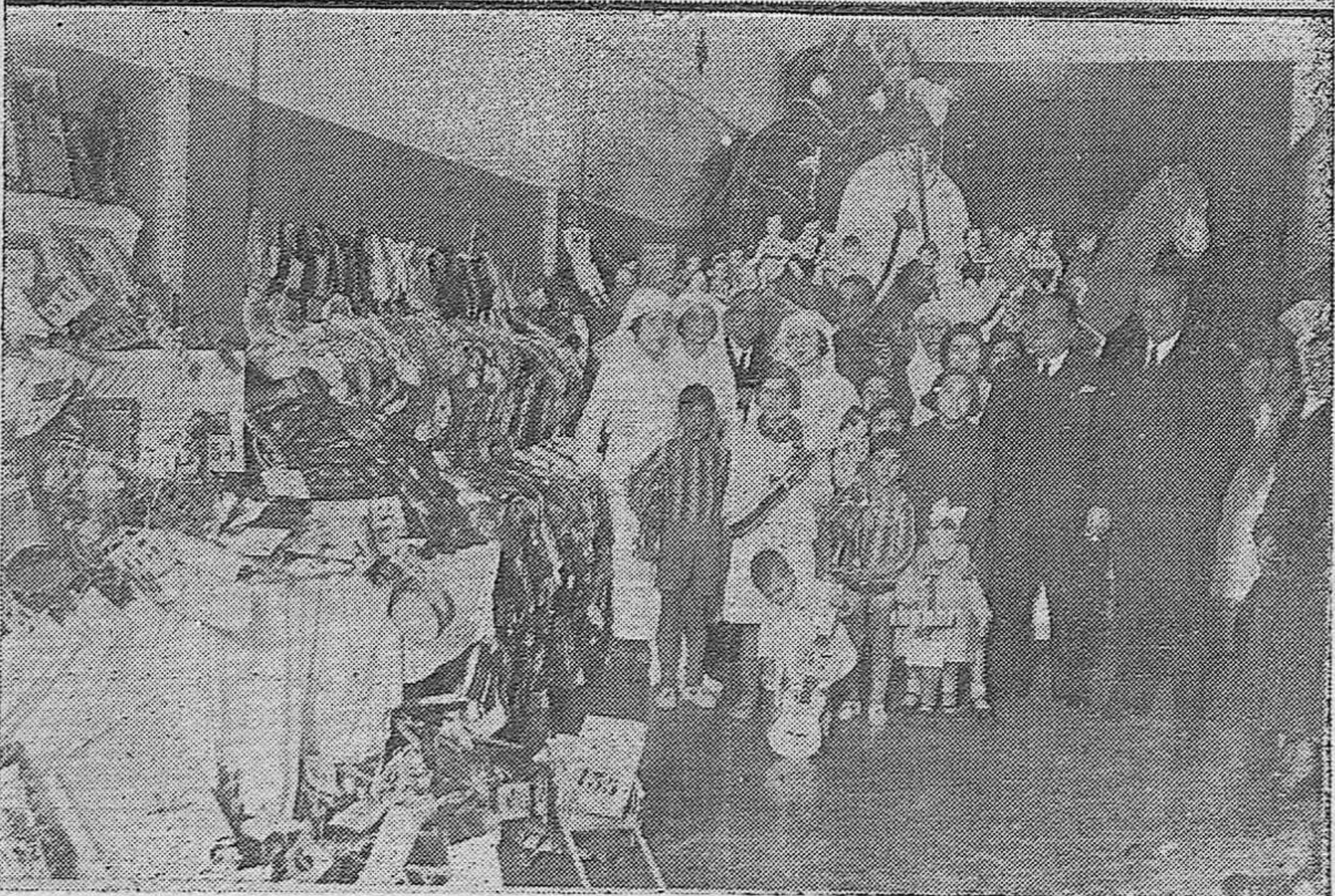
Arriba: Conferencia dada en el Círculo de la Amistad por el Inspector jefe de primera enseñanza de la provincia de Jaén a la selección de maestros católicos celebrada en el Círculo de la Amistad.—Abajo: Reparto de juguetes en el Hospital de la Cruz Roja a los niños que recibieron asistencia durante el año que finaliza