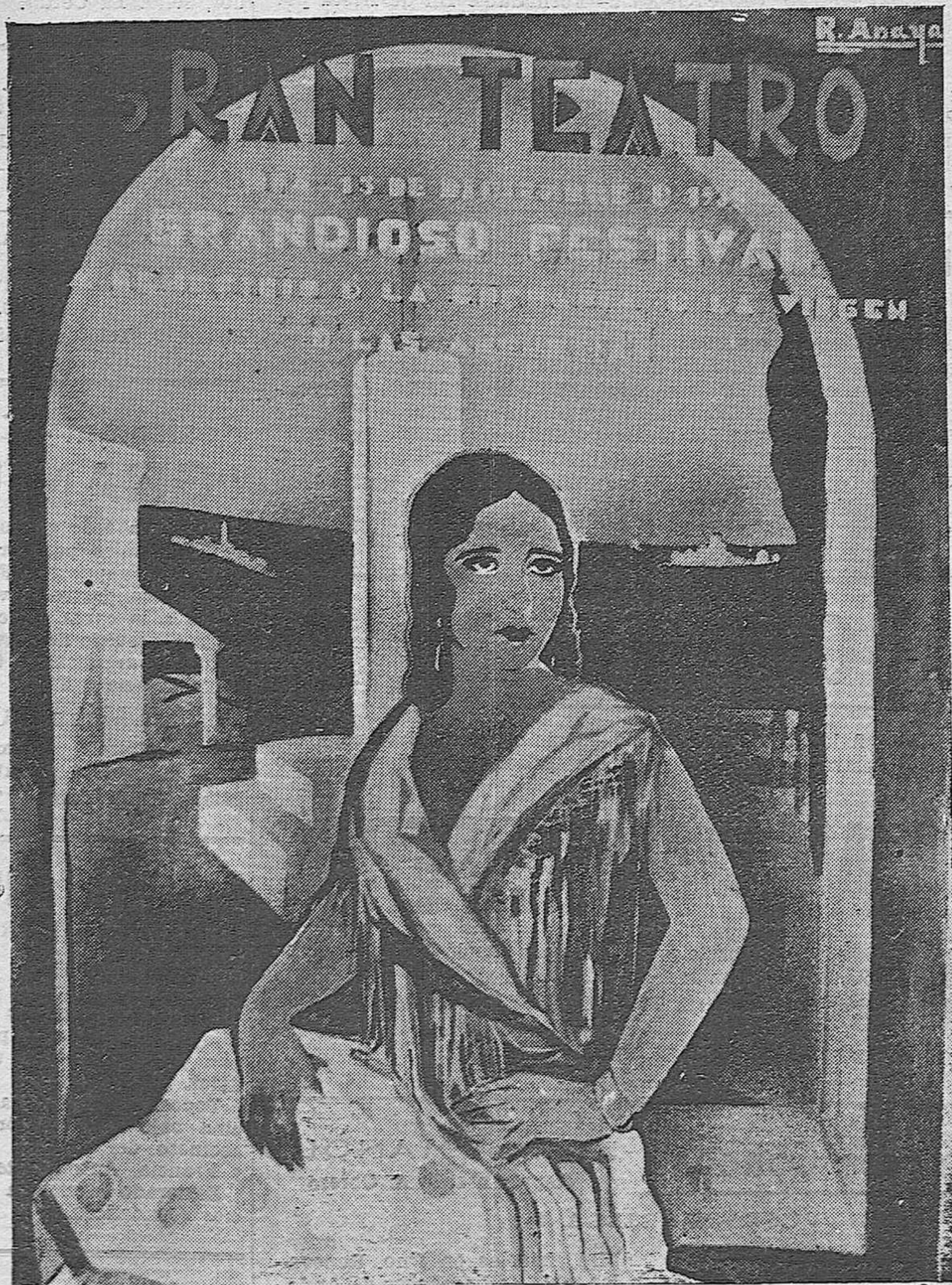
Cartel anunciador del Festival Benéfico que se celebrará en el Gran Teatro el día 13 de los corrientes, obra del joven artista señor Anaya.