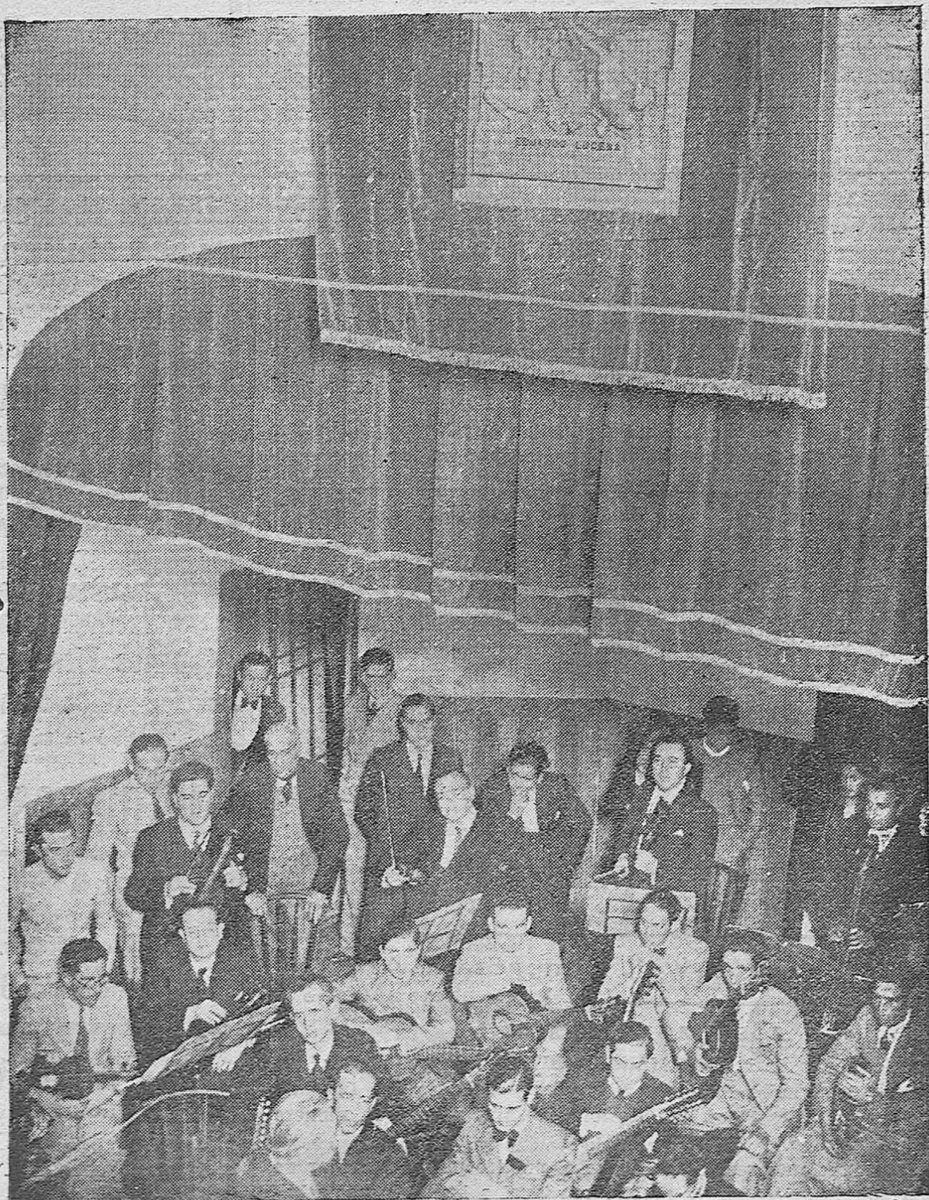
En el Centro Filarmónico "Eduardo Lucena" se celebró el sábado último una velada artística, durante la cual se descubrió una lápida al ilustre maestro.—He aquí un momento del acto.