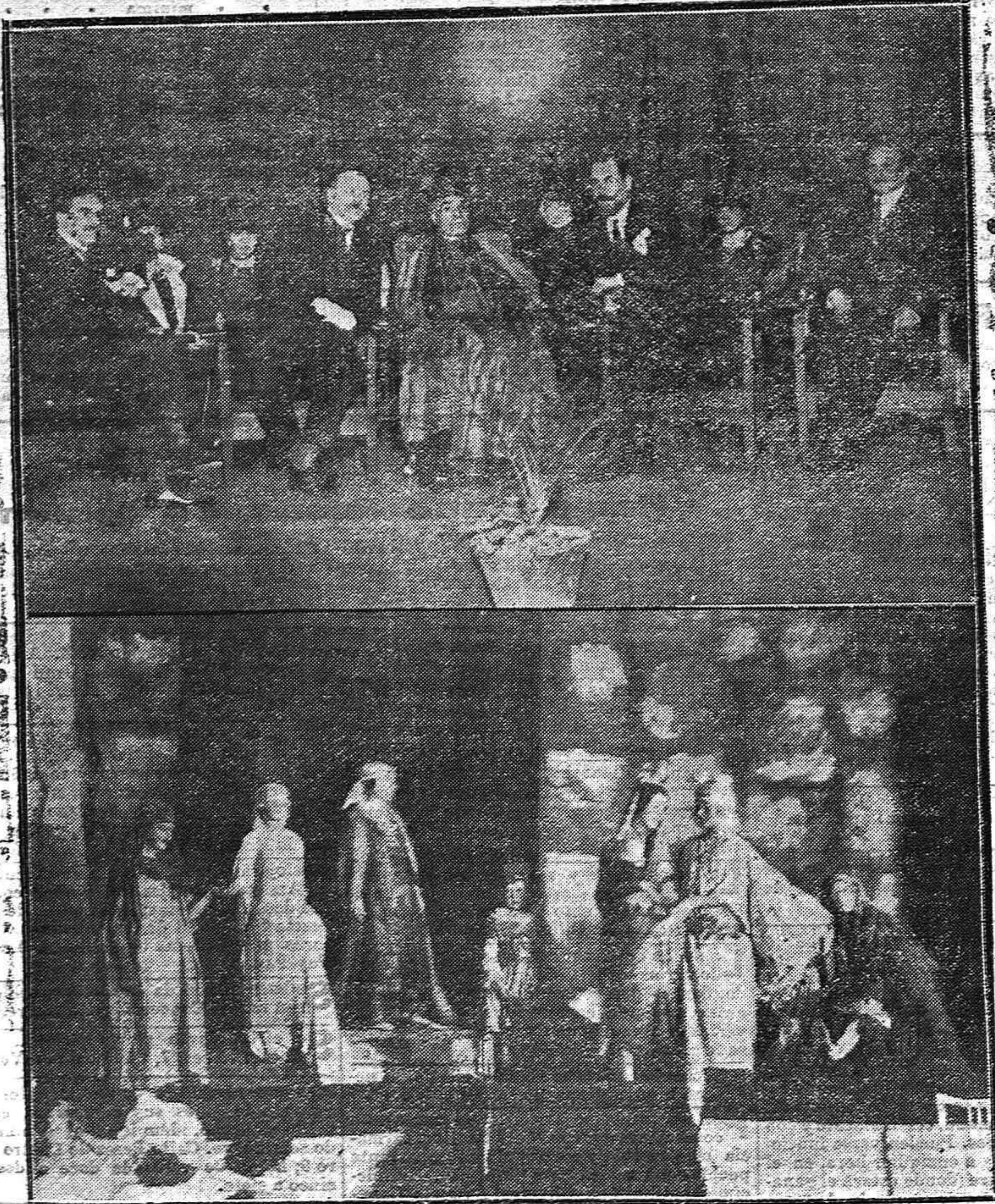
NOTAS GRÁFICAS. --El obispo de la diócesis y demás autoridades que presidieron el festival de ayer celebrado en el teatrillo de la calle Valladares.--Encantadoras niñas que representaron el cuadro plástico «Santa Isabel de Hungría»