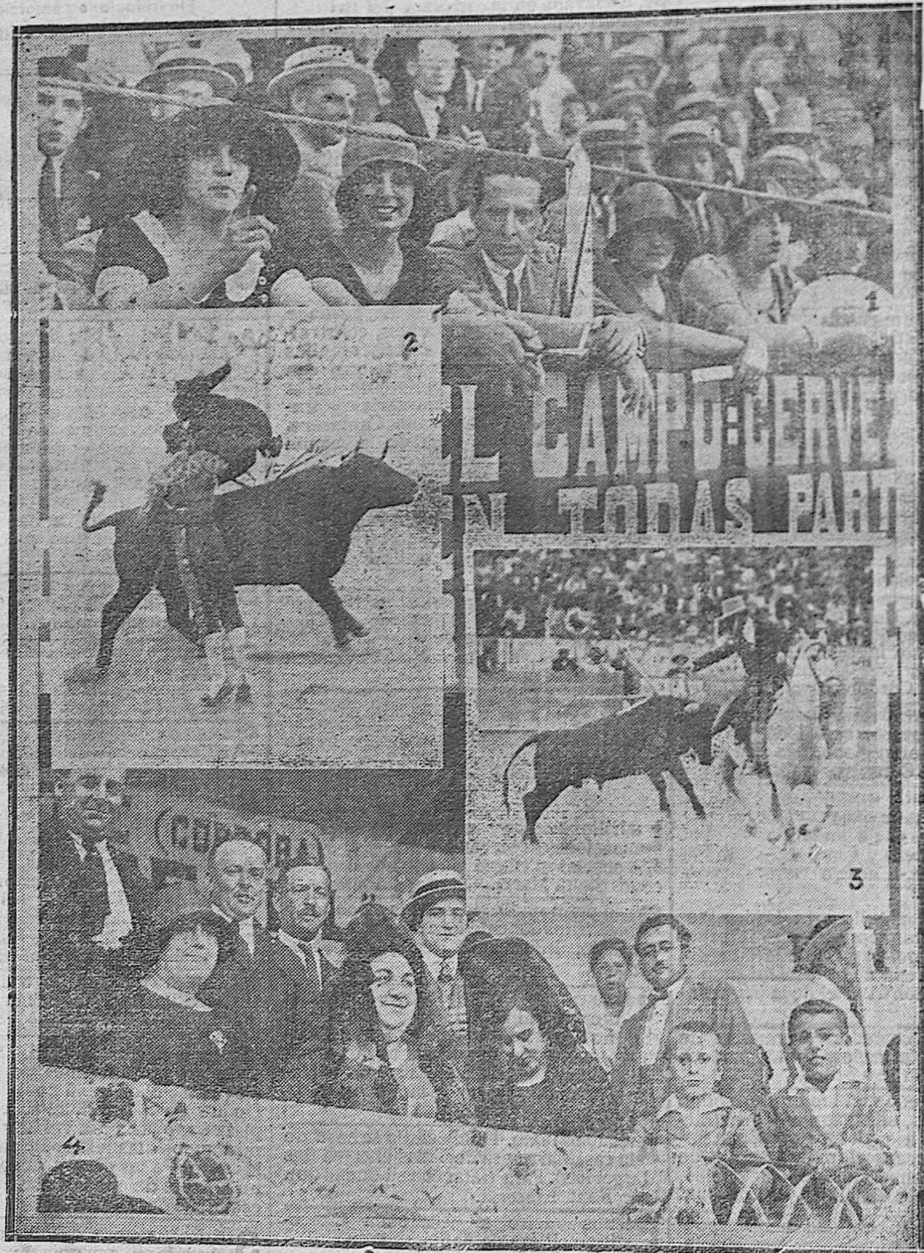
CABRA. —1) DISTINGUIDAS DAMAS CORDOBESAS PRESENCIANDO LA CORRIDA DE AYER. —2) PAREJITO EN POR ALTO. —3, UN GRAN MOMENTO DE CAÑERO. —4) DETALLE DE UN PALCO.