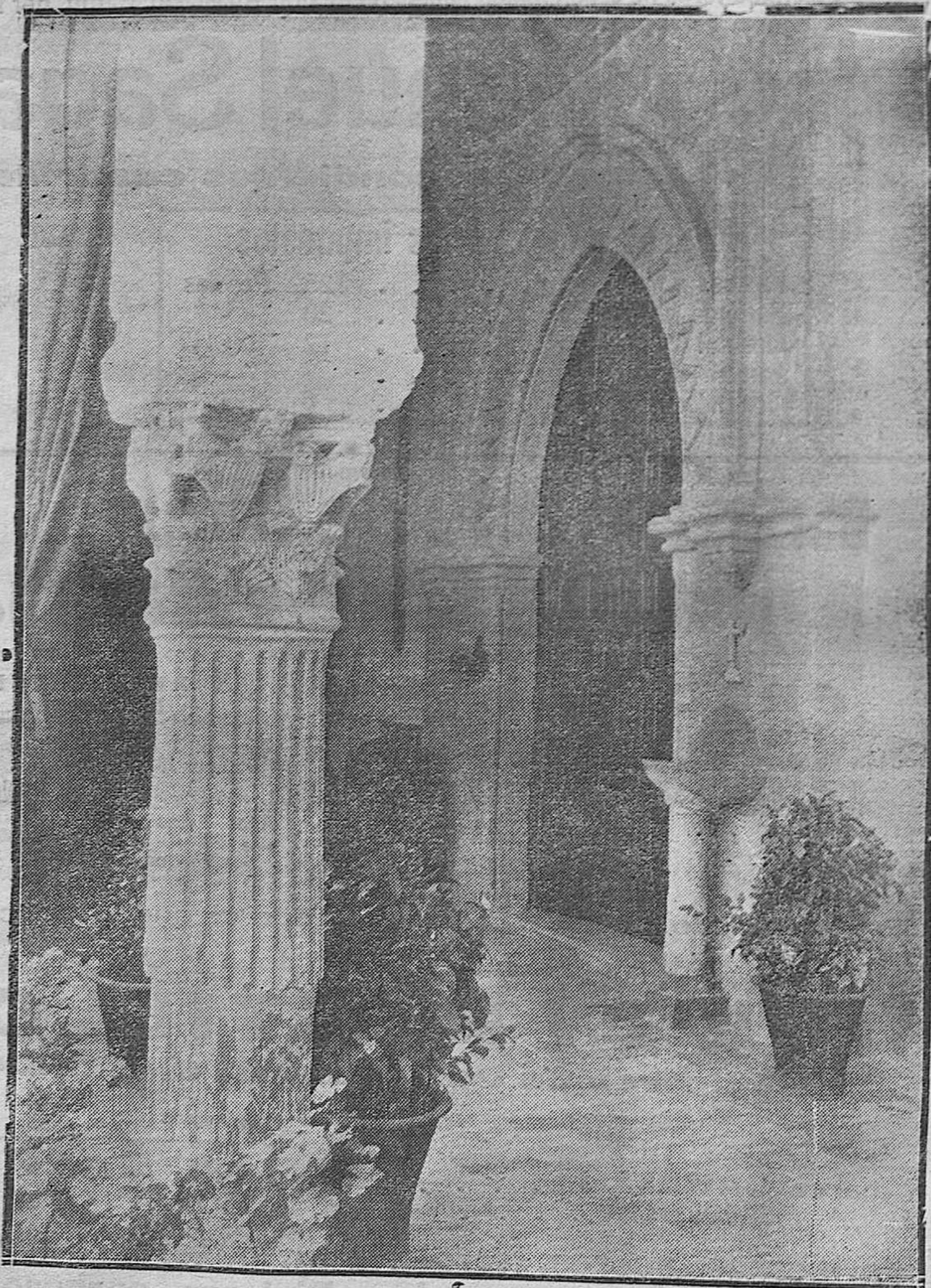
CÓRDOBA. — ARTISTICA PORTADA Y CAPITAL DE LA CAPILLA DEL HOSPITAL DE AGUDOS, DE EXTRAORDINARIA