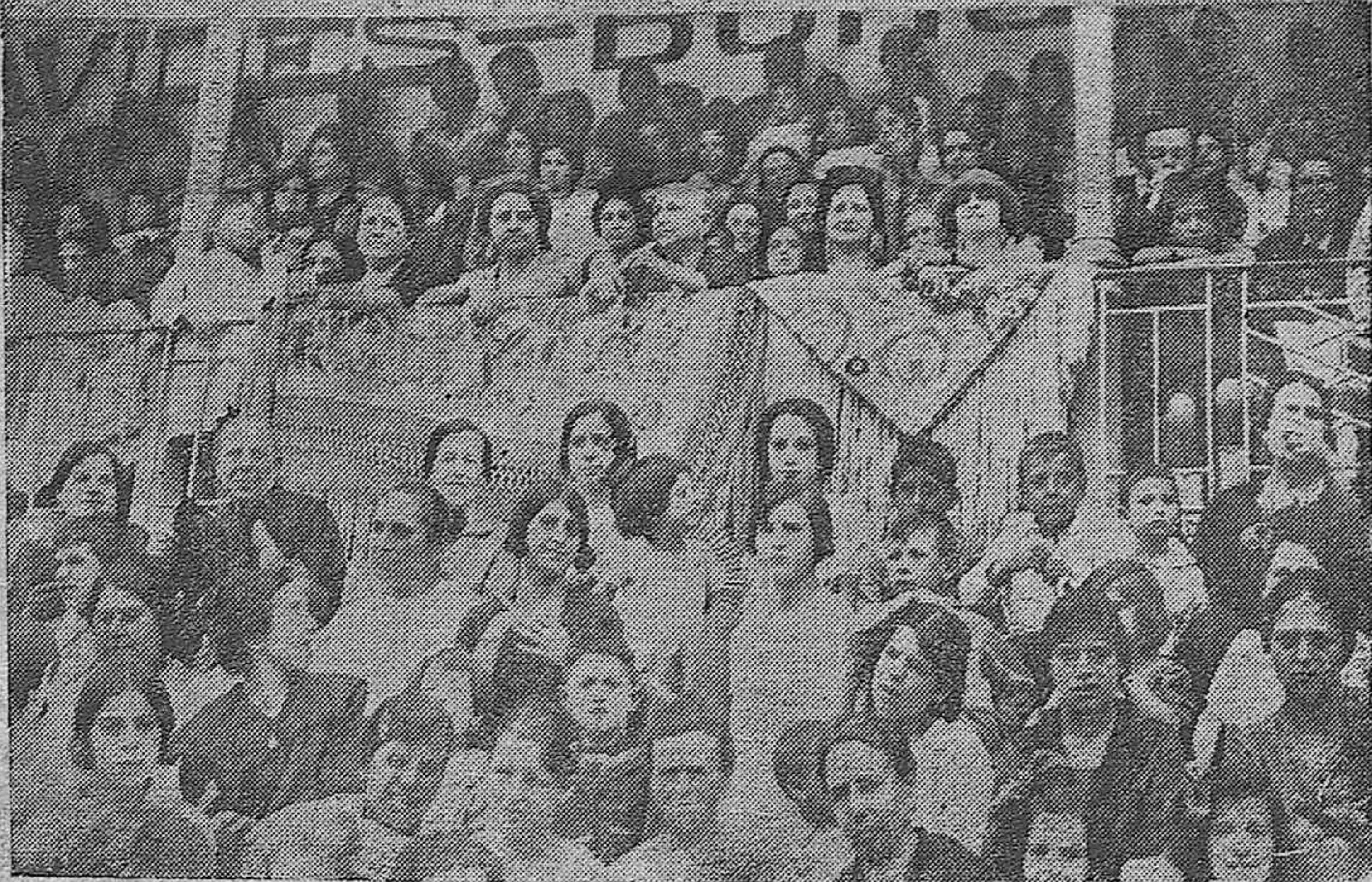
1) CONVOCIA DE AFICIONADOS QUE TOMARON PARTE EN LA RECERRADA DEL CLUB GUERRITA. 2) PINTORESCO ASPECTO DE UNO DE LOS TENDIDOS DE LA PLAZA DE TOROS DURANTE LA RECERRADA.