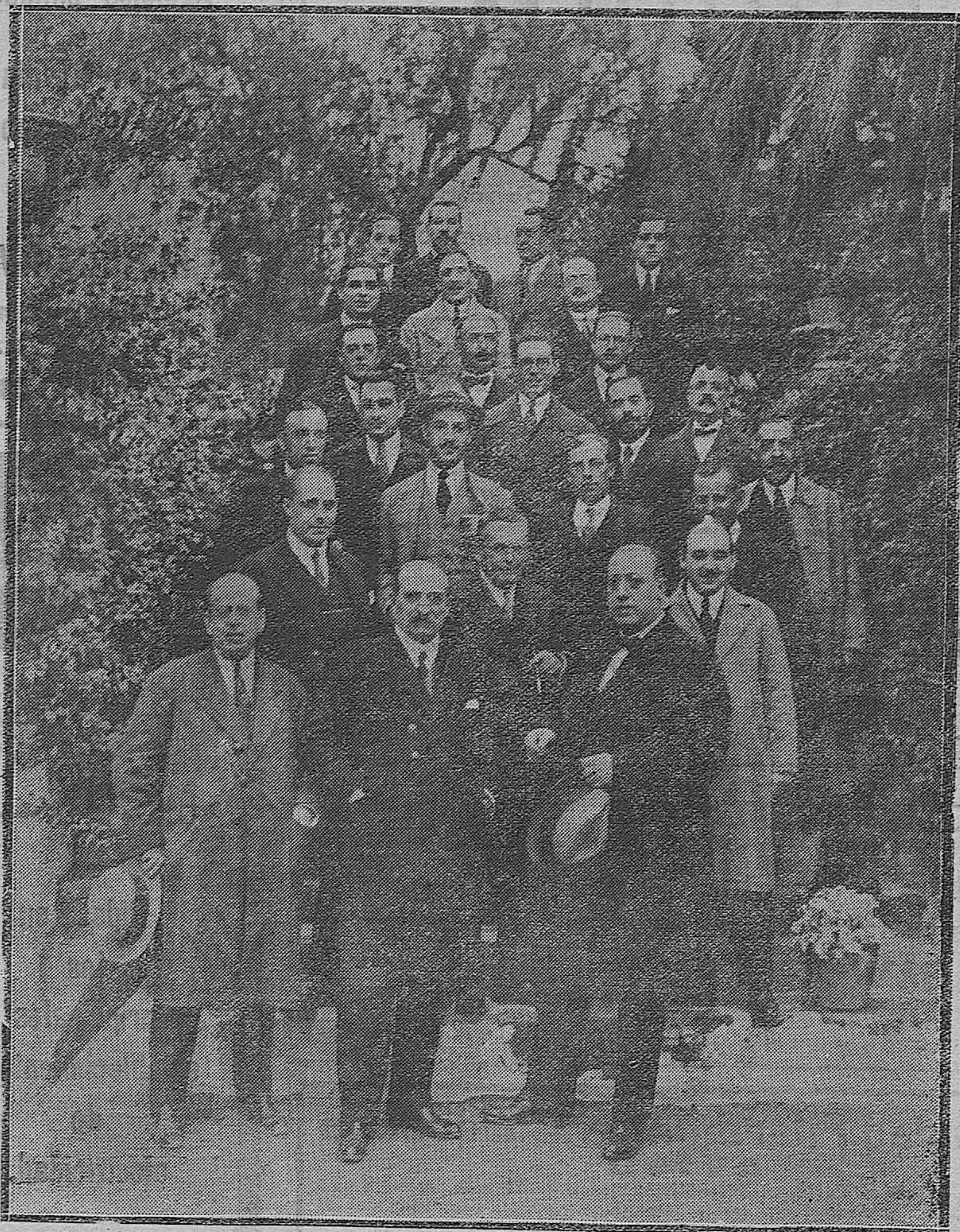
DE LA ASAMBLEA MEDICA.--Grupo de assembleistas que fueron obsequiados con una gira a la pintoresca huerta de la Arruzafa, de los señores de Carbonell.