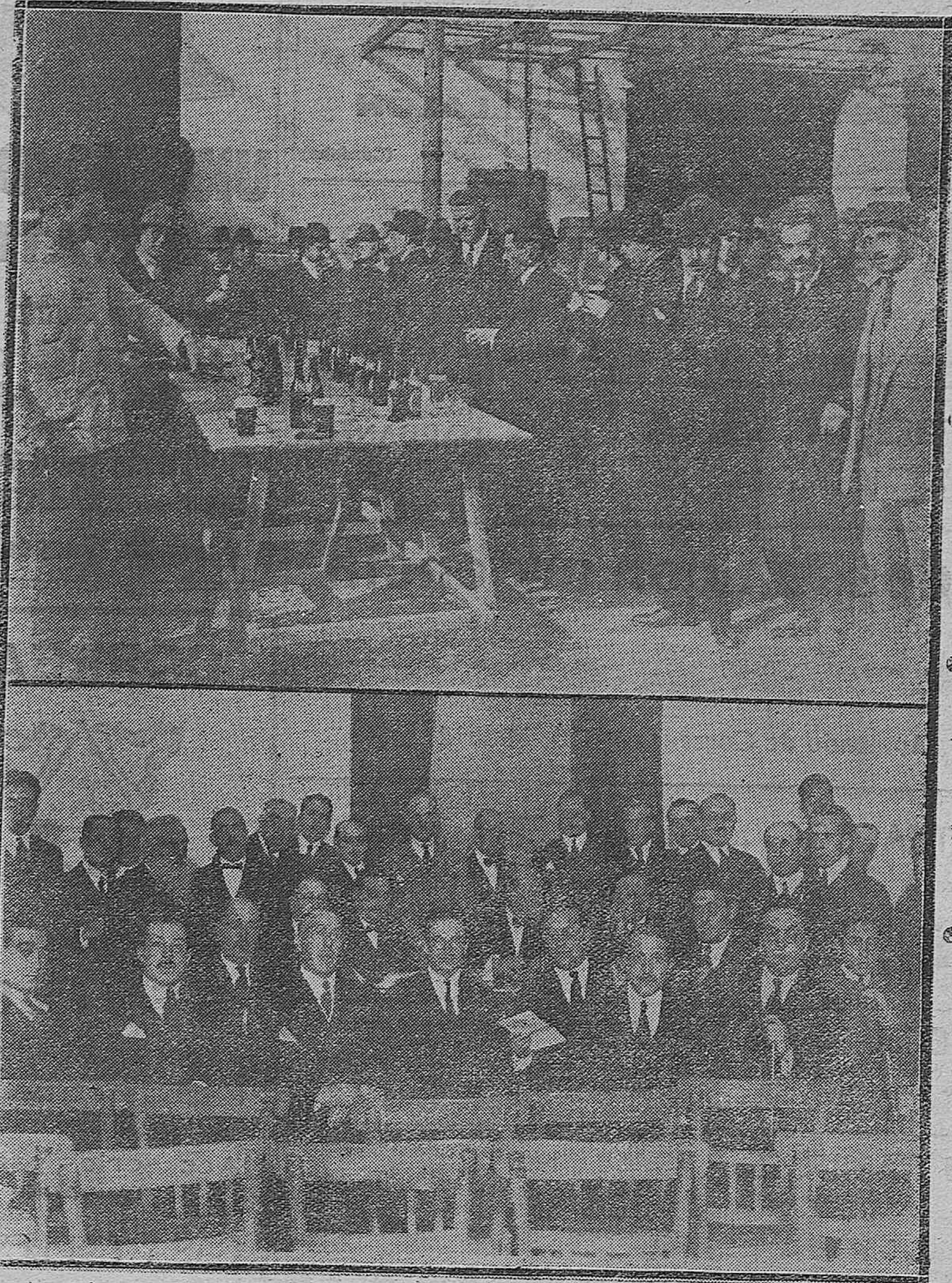
1) Grupo de assembleistas que fueron obsequiados con una cerveza de honor por el señor Marqués de la Mota de Trejo en su importante fábrica.—2) Médicos titulares de la provincia, concurrentes a la importante asamblea convocada por el Colegio de Córdoba.