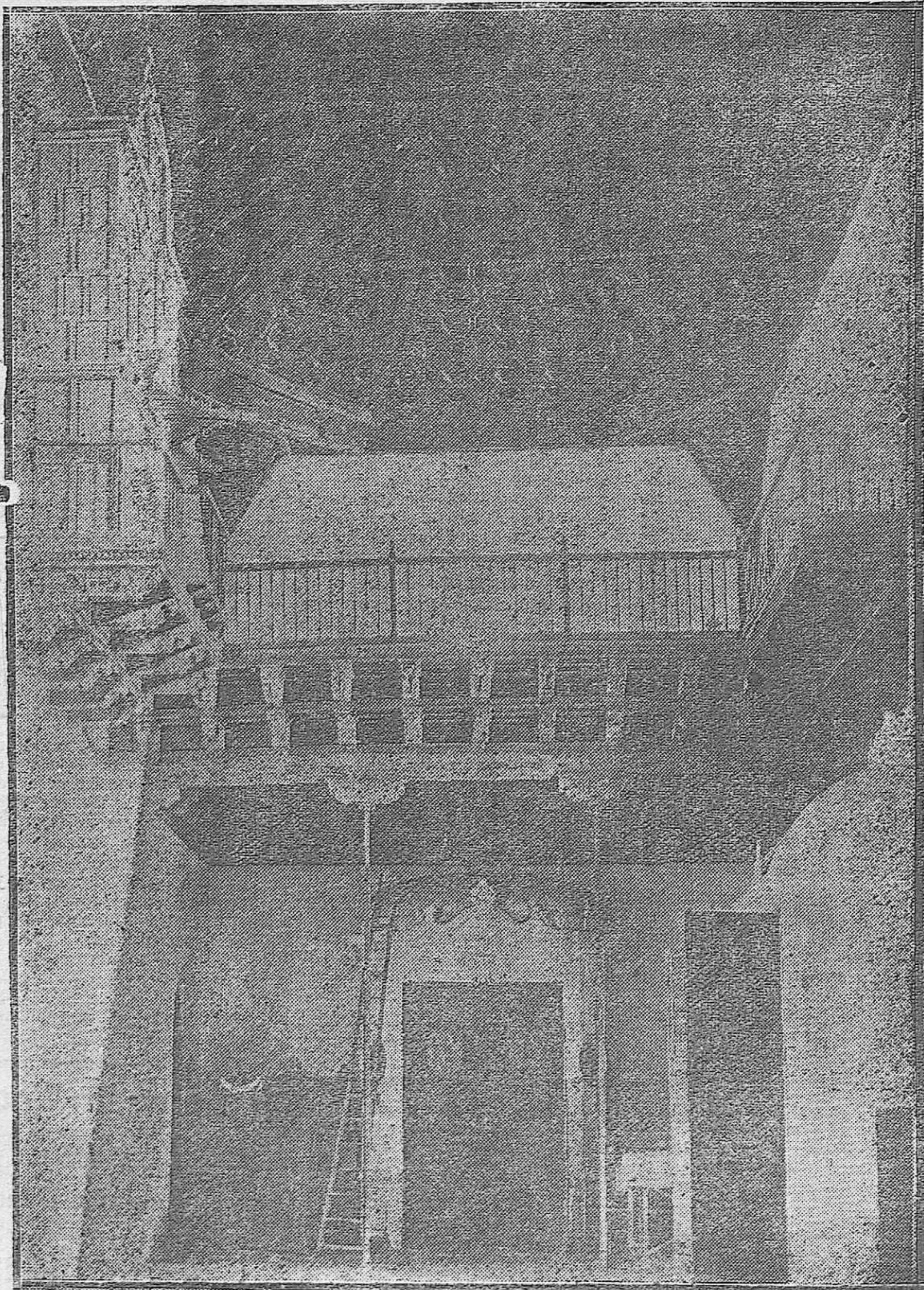
Artístico artesonado y coro de la iglesia de los Carmelitas de la Puerta Nueva, donde se conserva el retablo de Valdés Leal.