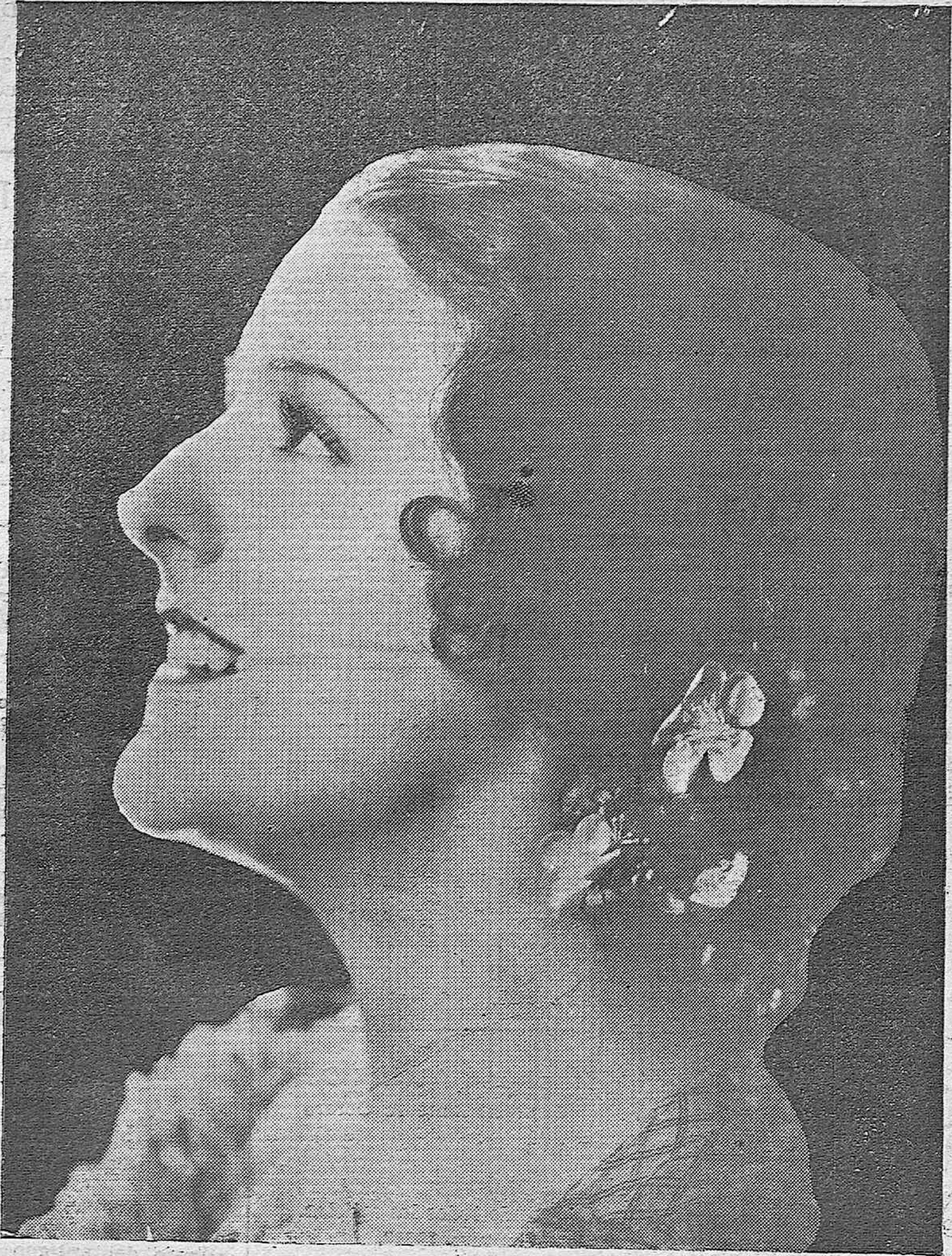
La bellísima "star" de Cifesa Imperio Argentina, genial protagonista de "Nobleza Baturra". (Foto Cifesa).