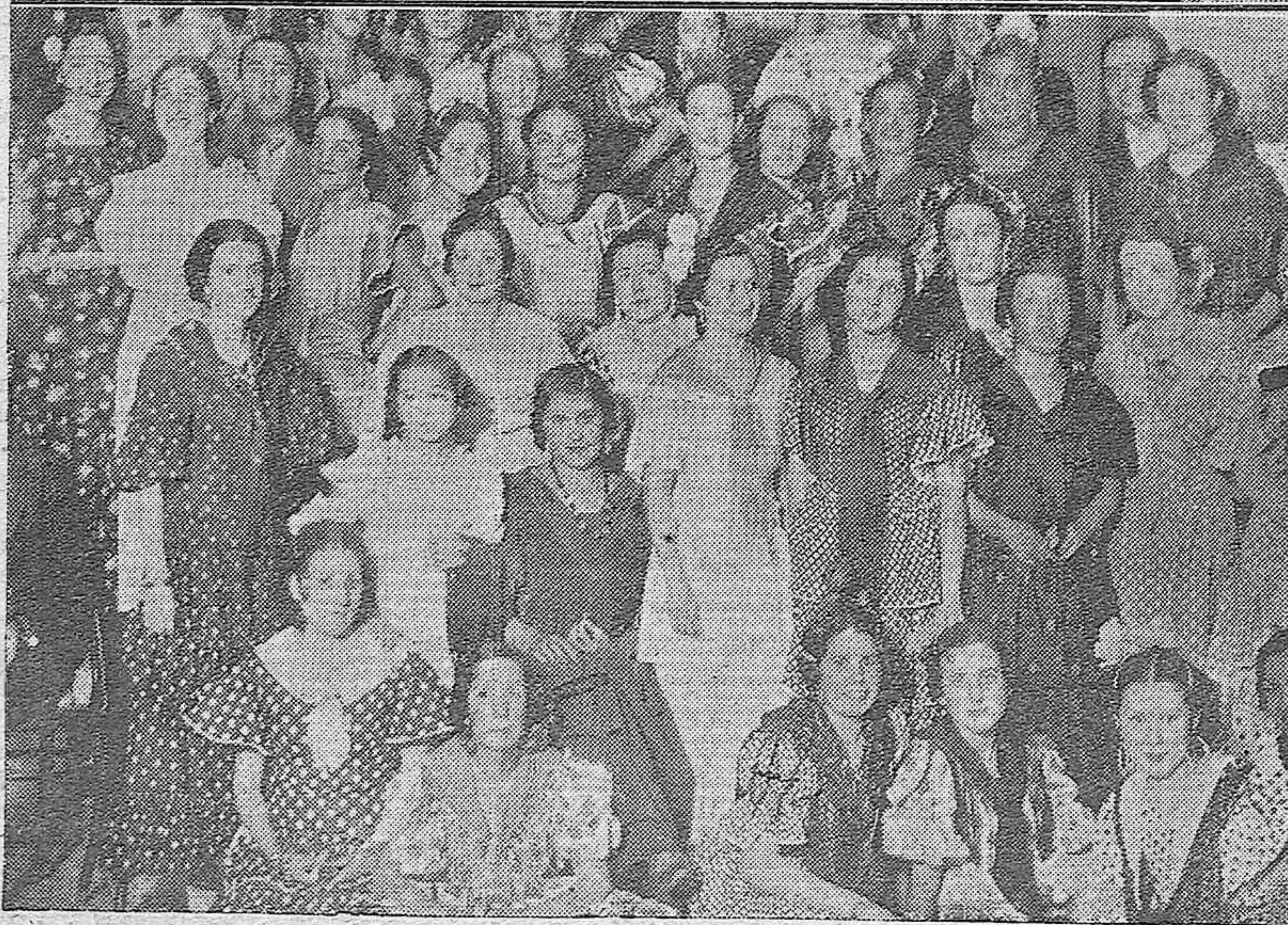
Alumnos de la Escuela Superior de Pintura, Escultura y Grabado de Madrid, que han visitado nuestra capital para conocer los principales monumentos.—Abajo: Bellas señoritas que asistieron a la fiesta celebrada en el Casino Ecijano de aquella localidad.