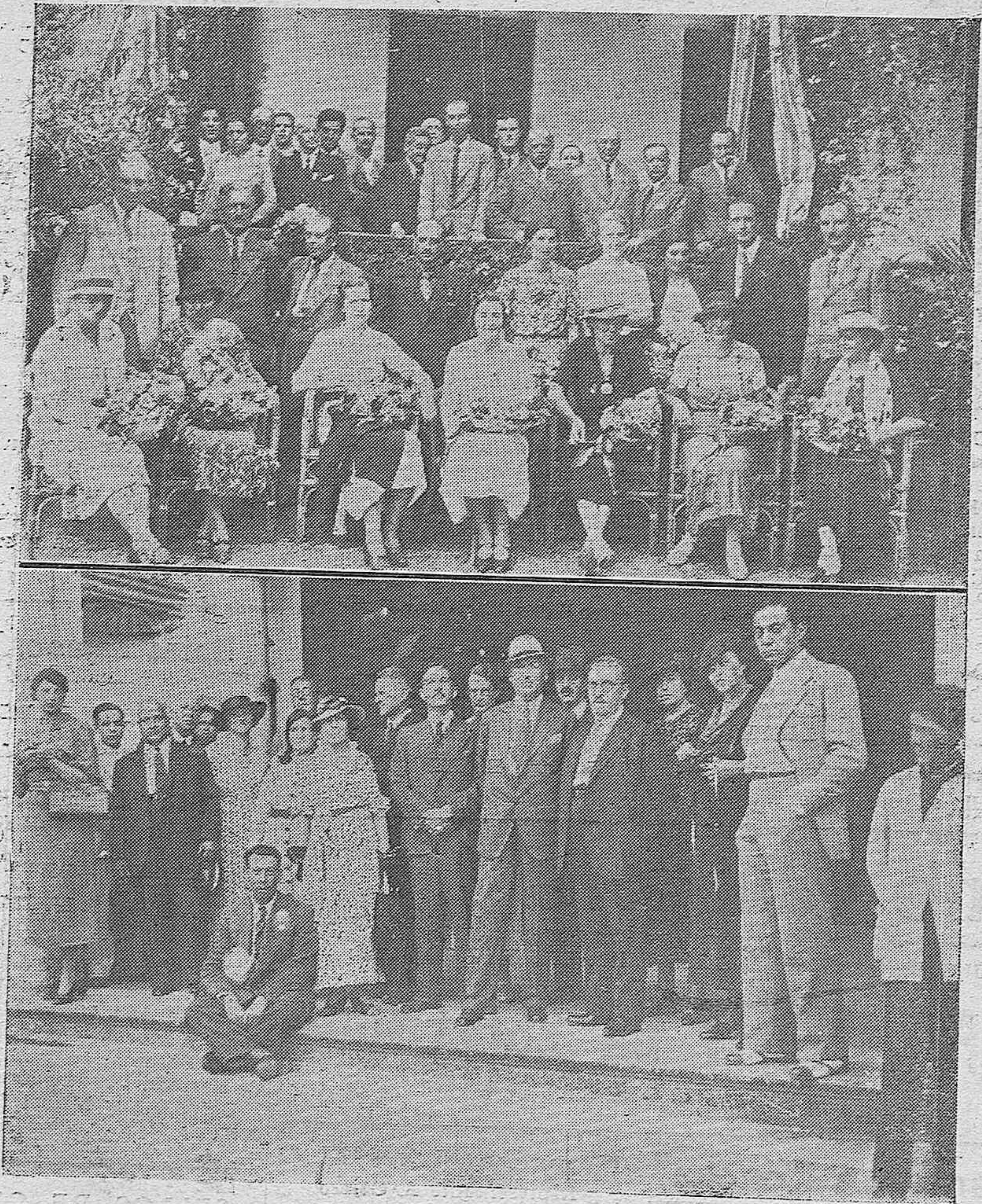
Miembros de los Congresos Internacionales de Entomología y de Medicina, que han asistido a las sesiones celebradas en Madrid y que realizan una excursión por Andalucía.—Los Congresistas durante su estancia en nuestra capital.